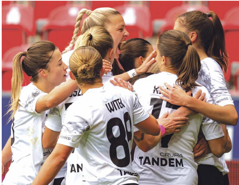
W meczu finałowym Pucharu Polski nasze piłkarki dwukrotnie wychodziły na prowadzenie, ale ostatecznie musiały uznać wyższość rywalków z Katowic. Lada moment Czarne mogą się jednak cieszyć z tytułu mistrzyń Polski, który jest już na wyciągnięcie ręki.

GKS rzucił wszystko na jedną szalę i ruszył do odrabiania strat, narażając się na kontry So-