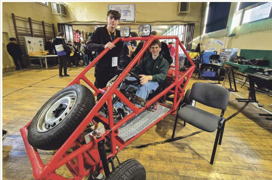
Uczniowie CKZiU otrzymają m.in. samochodowe stanowiska demonstracyjne.

Remont przejdzie także PM nr 40 przy ul. Gwiazdnej 16d. W tej placówce zaplanowano modernizację sześciu pomieszczeń sanitarnych