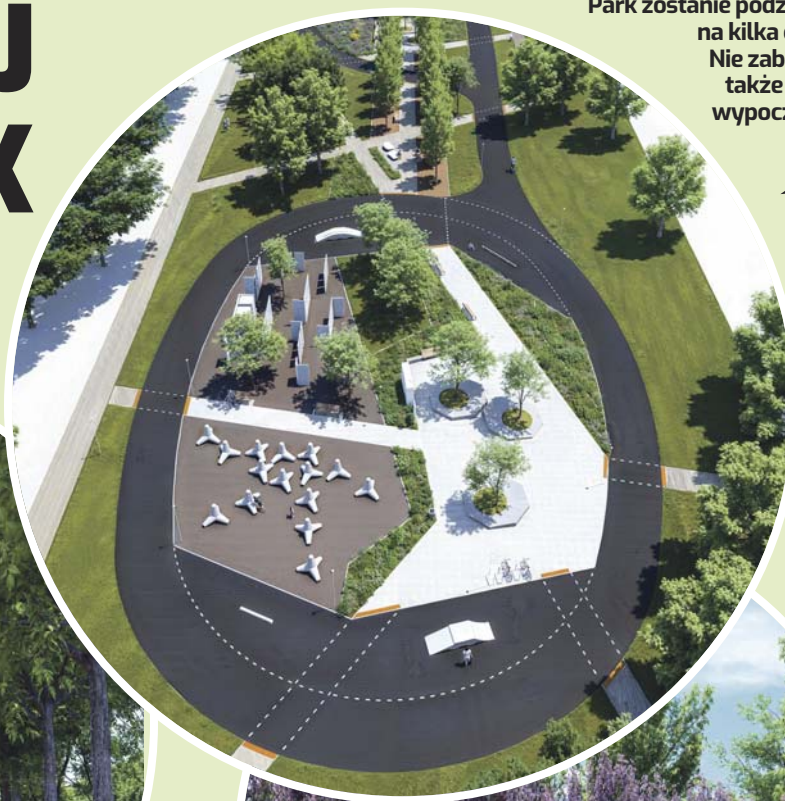
Park zostanie podzielony na kilka części. Nie zabraknie także strefy wypoczynku.