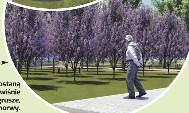
W parku zostaną posadzone wiśnie piłkowane, grusze, jabłonie i morwy.