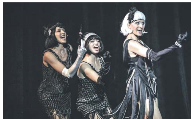
Spektakl „Filmofonia. Koncert piosenek filmowych” zabierze widzów w muzyczną podróż lat 20. i 30. XX wieku.

Teatr Zagłębia dla wszystkich pań przygotował niezwykle propozycję z okazji Dnia Kobiet, który mogą obchodzić 8 i 9 marca. W tych dniach wyreżyserowany przez Jacka Jabrzyka, zastępcę dyrektora spektakl „Filmofonia” zabierze widzów w podróż do lat 20. i 30. XX wieku, kiedy to muzyka towarzyszyła filmowi od samego początku. – Proponujemy rewiową opowieść utkaną z filmowych piosenek. Przeniesiemy się w czasy młodego kina, w czasy kabaretów, tańców, zadymionych kawiar-