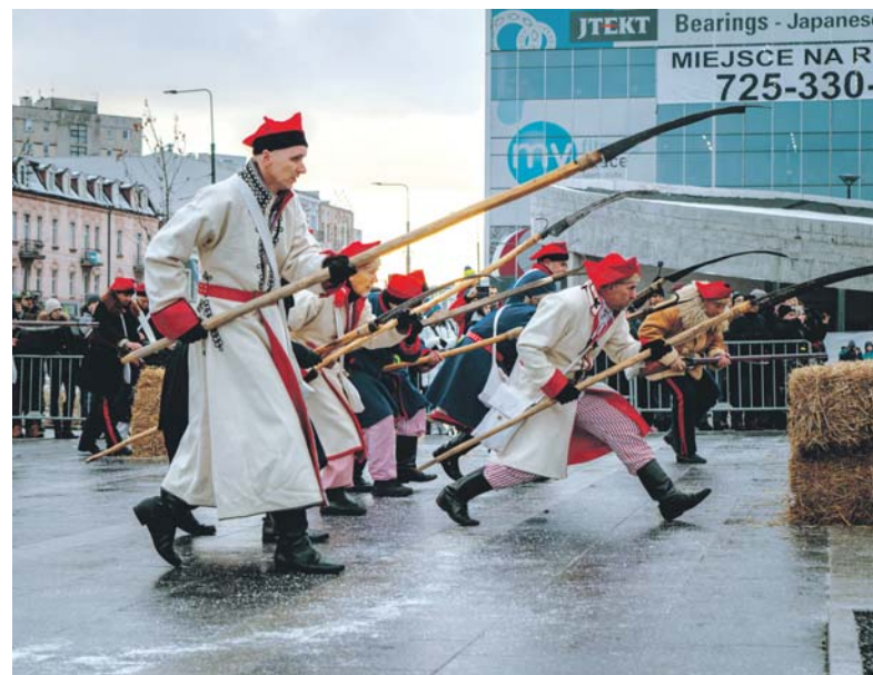
W tę niedzielę pod dworcem odbędzie się m.in. rekonstrukcja bitwy o Sosnowiec.