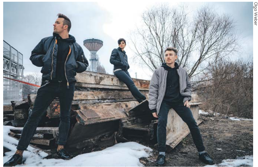
Początki zespołu sięgają 2012 roku.

Wideoklip powstawał przed jednym z bloków na osiedlu przy ul. Jagiellońskiej