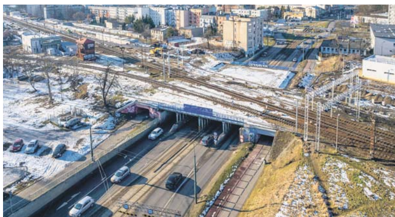
Wiadukt w centrum miasta musi być przebudowany ze względu na jego stan techniczny.