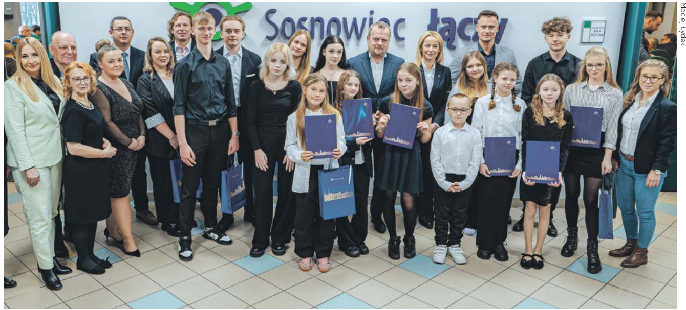
Laureaci miejskiego stypendium artystycznego w roku szkolnym 2024/2025 odebrali wyróżnienia podczas styczniowej sesji Rady Miejskiej.