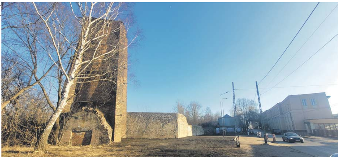
Tablica znajdować się będzie przy murze przy wieży przy ul. Staszica, na przeciwko wejścia na teren dawnej huty.