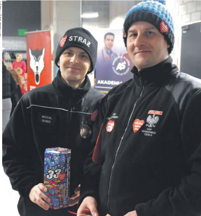
W zbiórkę na rzecz WOŚP jak co roku włączyli się strażacy z OSP Sosnowiec Cieśle.