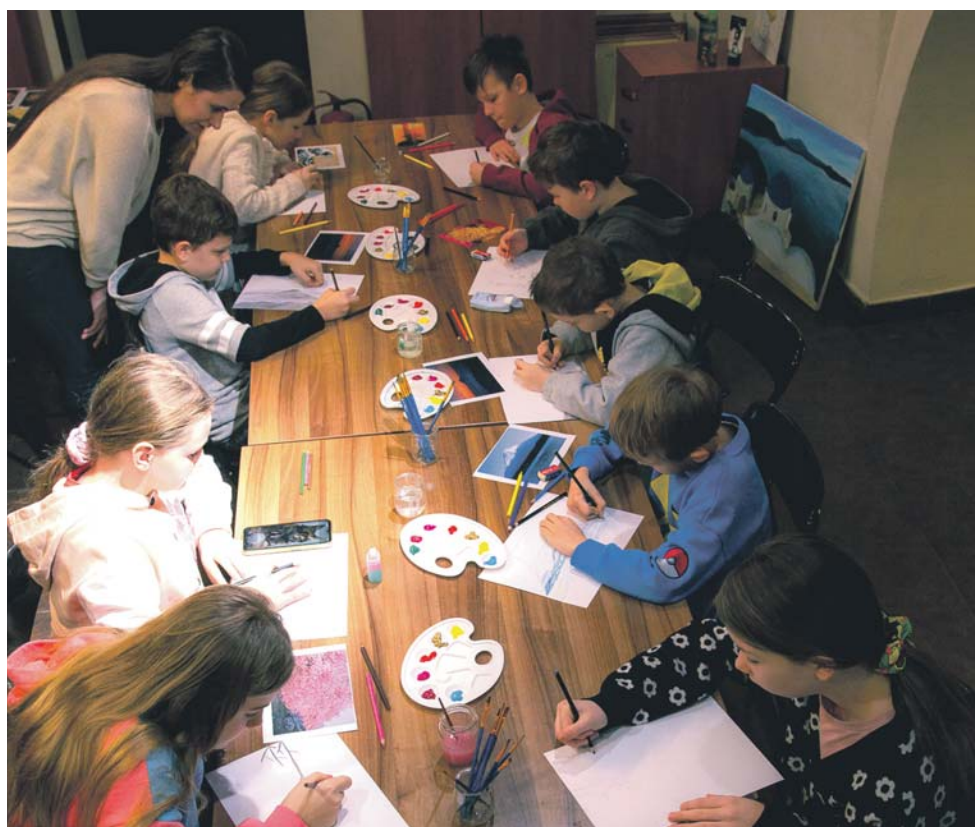
Współczesne oblicze sztuki poznają uczestnicy warsztatów w Zamku Sieleckim.

znalazły zajęcia na temat art landu, suprematycznych kompozycji, monotypii i tworzenia instalacji.