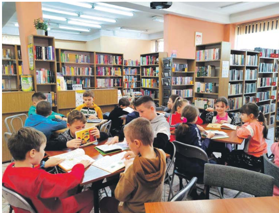
Na zajęcia zapraszają wszystkie filie Miejskiej Biblioteki Publicznej.

Zajęcia dla dzieci będą odbywać się we wtorki i czwartki w godzinach od 10.00 do 12.00 w terminach 18, 20, 25 i 27 lutego. Obowiązują zapisy, wstęp jest bezpłatny. W programie