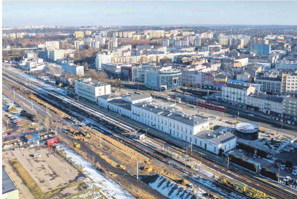
Cała stacja Sosnowiec Główny zostanie gruntownie przebudowana.

Żeby pociągi zatrzymywały się na nowym przystanku na Śróduli, potrzebny jest drugi peron w kierunku Zawiercia. Kiedy będzie gotowy?