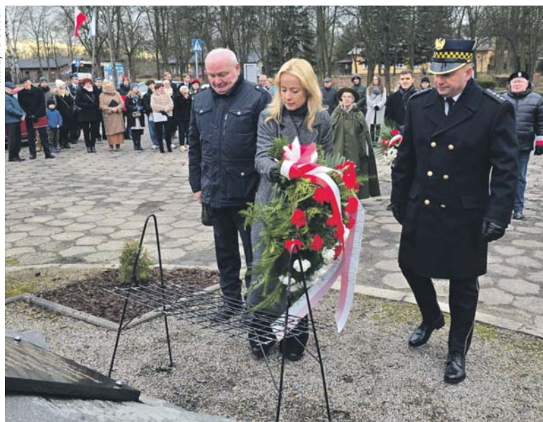
Już kilka dni temu rocznicę powstania styczniowego świętowano w Maczkach.