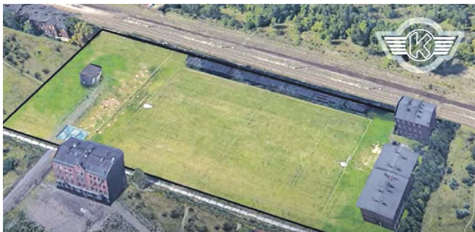
Autor filmu w komputerowym programie odtworzył wygląd dawnego boiska Kolejarza. W lewym górnym rogu widoczny jest Dworzec Południowy, w górze zdjęcia widać też tory kolejowe.

Dzisiaj w miejscu, gdzie kiedyś piłkarze Kolejarza rywalizowali o ligowe punkty, stoi Supermarket, budynek, w którym latach 80. moż-