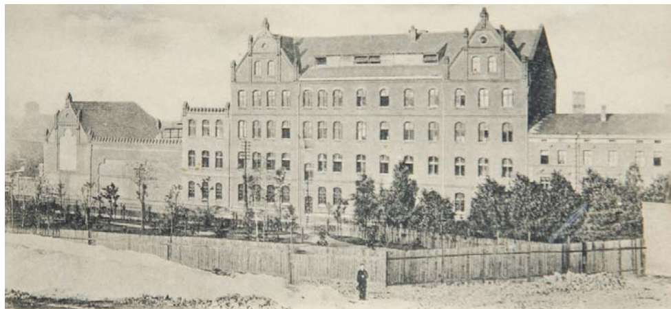
Biurowiec na zdjęciu z 1918 roku.