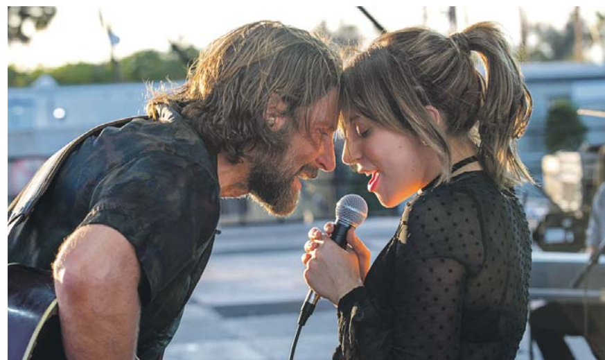
Kard z filmu „Narodziny gwiazdy” z Lady Gagą.

W ramach FFM zobaczymy takie tytuły jak: „Dla Ciebie śpiewam” z udziałem Jana Kiepury i Marty Eggerth, „Narodziny gwiazdy” z Lady Gagą (reż. Bradley Cooper), „Spotkajmy się w St. Louis” (1944) z młodą Judy Garland, „Judy” (reż. Rupert Goold), „Kwartet” (reż. Dustin Hoffman) i „Pavarotti” (dokument, reż. Ron Howard).