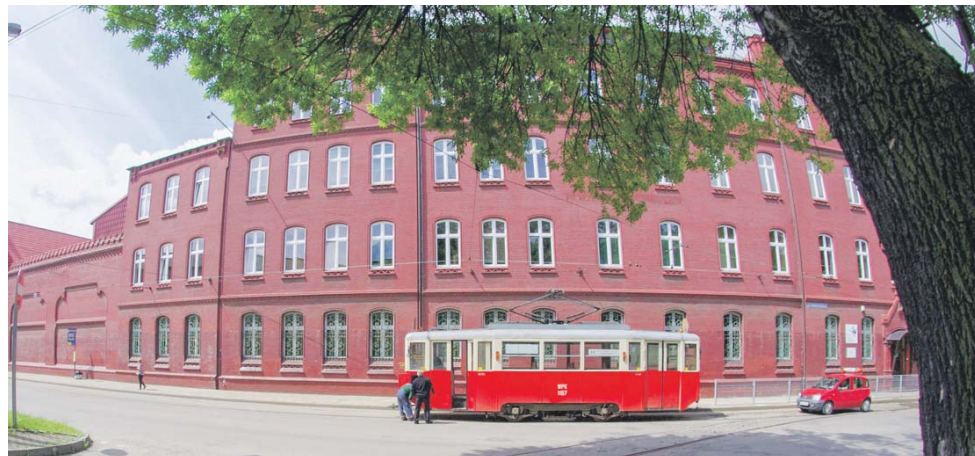
Przy ulicy Stanisława Staszica 31 znajduje się zabytkowy fabryczny biurowiec. Przed nim widzimy tramwaj typu 4N z 1957 obsługujący linię 24. Fotografia z czerwca 2015 r.

W 1918 roku uruchomiono produkcję kotłów parowozowych – głównym odbiorcą była Pierwsza Fabryka Lokomotyw w Polsce Spółka Akcyjna Zakłady w Chrzanowie (późniejszy Fakop). W październiku 1928 r. doszło do fuzji z firmą Polskie Fabryki Maszyn i Wagonów L. Zieleniewski SA w Krakowie co sprawiło, że zakład przyjął nazwę Zjednoczone Fabryki Maszyn, Kotłów i Wagonów L. Zieleniewski i Fitzner-Gamper SA w Sosnowcu. W roku 1929 firma została wydzier-