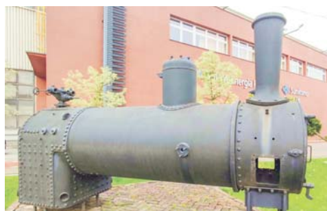
Pierwszy kocioł od Fitznera i Gampera został wyprodukowany w kwietniu 1881 r. – dla kopalni Michał w Czeladzi. Prezentowany na zdjęciu kocioł parowozu wąskotorowego został wyprodukowany w 1947 r. Ekspozat znajduje się obok hali produkcyjnej PR 3 przy ul. Chemicznej.