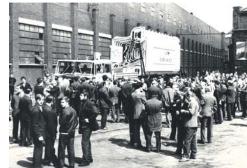
Uroczystość z okazji wyprodukowania dziesięcioletniego kotta – czerwiec 1972 r.

zawiona spółce tworzonej przez Polskie Zakłady Babcock i Witcox Ltd w Londynie oraz L. Zieleniewski i Fitzner – Gamper w Krakowie, przy czym Anglicy posiadali 50,1% akcji.