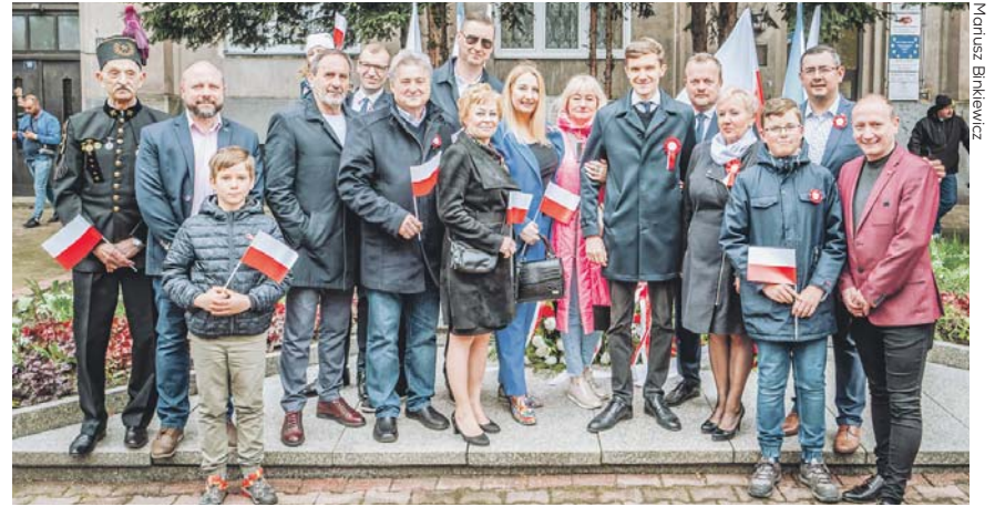
Dzień Flagi Rzeczypospolitej Polskiej będziemy obchodzić 2 maja.

1 maja będziemy obchodzić jubileuszową 20. rocznicę przystąpienia Polski do Unii Europejskiej. Z tej okazji w parku w Kazimierzu o godz. 11.00 odbędzie się gra terenowa dla dzieci „Powrót do gniazda” i w samo południe na Trójgącie Trzech Cesarzy zostaną złożone kwiaty. Wystąpi Sosnowiecka Orkiestra Dęta. Nie zabraknie wspólnego odśpiewania „Ody do radości” i animacji do dzieci. Uroczystości zakończą się wspólnym ogniskiem i pieczeniem kiełbasek. Sosnowiecka Orkiestra zagra także rano na placu Powstańców Śląskich (ok. 10.00), Stawkach (10.20), Placu Papieskim (10.45) i Parku Kuronia (11.15.). Na drugi dzień z okazji Dnia Flagi Rzeczypospolitej Polskiej w Parku im. Jacka Kuronia w Kazimierzu przygotowano dla dzieci niespodzianki i upominki patriotyczne. Nowi mieszkańcy Sosnowca będą się integrować ze społecznością lokalną w ramach popołudniowego wydarzenia, jakim będzie wspólny bieg. O godz. 17.00 rozpocznie się w parku bieg pod hasłem „Sosnowiec – miasto wielu kultur”. Zawodnicy, którzy będą mieć do pokonania około 3600 metrów, wystartują spod Muszelki. W tym miejscu organizatorzy przygotowali też mecie. Trasa biegu przebiegać będzie ulicami Sosnowca i alejkami Parku im. J. Kuronia. Dystrans wyniesie 3600 metrów. Rozgrzewkę