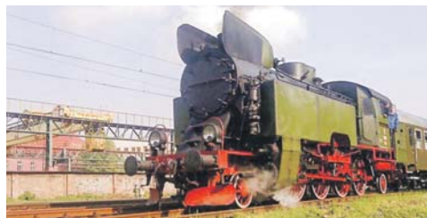
Parowóz TKt48-191 z 1957 r. poprowadził pociąg specjalne z okazji 130-lecia firmy (27 i 28 maja 2010 r.). W tle widoczne są zabudowania Fakopu.

zawiona spółce tworzonej przez Polskie Zakłady Babcock i Witcox Ltd w Londynie oraz L. Zieleniewski i Fitzner – Gamper w Krakowie, przy czym Anglicy posiadali 50,1% akcji.