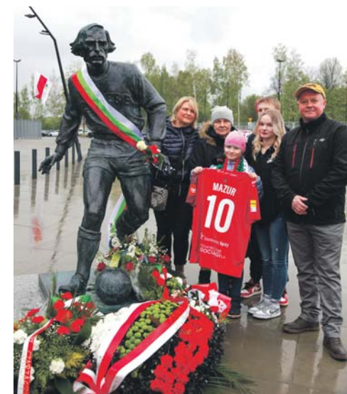
W uroczystości wzięła udział rodzina zmarłego piłkarza.