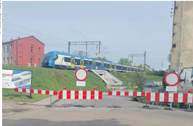
Z rejonu placu Kościuszki nie można przejechać na ul. Nowopogońską.

W Zagórzu rozpoczęła się budowa nowego ronda na skrzyżowaniu ulic Bora-Komorowskiego i Blachnickiego. Trwają również prace związane z budową okężnej organizacji ruchu na skrzyżowaniu Bora-Komorowskiego i Zaruskiego, której fragment jest już przejezdny. Utrudnienia czekają również między placem Kościuszki a ulicą Nowopogońską, gdzie zamknięty jest tunel pod torami kolejowymi.