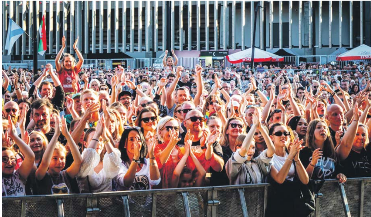
Koncertы drugi raz z rzędu odbywać się będą na terenie Zagłębiowskiego Parku Sportowego.

Imprezę jak co roku organizuje Wydział Kultury i Promocji Urzędu Miejskiego przy współpracy miejskich jednostek kultury i spółek. Nie jest jeszcze znany dokładny harmonogram wydarzeń, ale znamy już listę artystów, którzy w tym roku pojawią się w Sosnowcu. Prezentuje się ona dość okazale, a każdy z sosnowiczian powinien wybrać coś dla siebie.