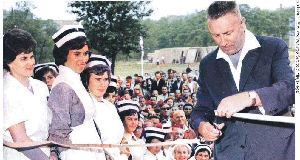
W 1964 roku na otwarciu szpitala wstęgę przecinał Edward Gierek, wówczas I sekretarz KW PZPR w Katowicach.

Dzisiaj Sosnowiecki Szpital Miejski prowadzi działalność leczniczą w czternastu oddziałach. W placówce funkcjonują także izba przyjęć, nowoczesny Zakład Diagnostyki Obrazowej, Laboratorium czy nocna i świąteczna opieka zdrowotna. Oddziały wyposażone są w nowoczesny sprzęt diagnostyczny. Placówka dysponuje 393 łóżkami dla pacjentów. Lecznica zatrudnia po-