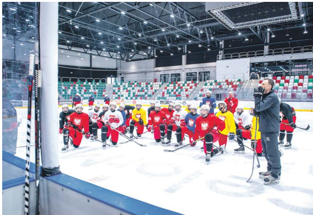
Młodzi hokeiści reprezentacji Polski szlifują formę przed mistrzostwami świata, które już za kilkanaście dni rozpoczną się w Sosnowcu.

W ArcelorMittal Parku w Sosnowcu Biało-Czerwoni będą walczyć o awans do wyższej dywizji z Wielką Brytanią, Serbią, Rumunią, Holandią i Chorwacją. Na wszystkie spotkania turnieju obowiązują te same ceny biletów – 10 zł (normalny) i 5 zł (ulgowy). Wejściówki są już dostępne w portalu kupbilet.pl Na miejscu będzie można je kupić w kasie biletowej, otwartej półtorej godziny przed rozpoczęciem meczów Polaków.