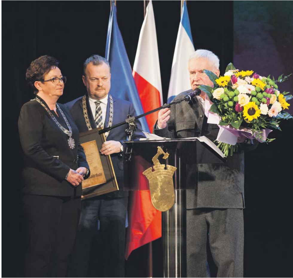
Krzysztof Materna dziękując za wyróżnienie wspominał swoje młode lata w Sosnowcu.