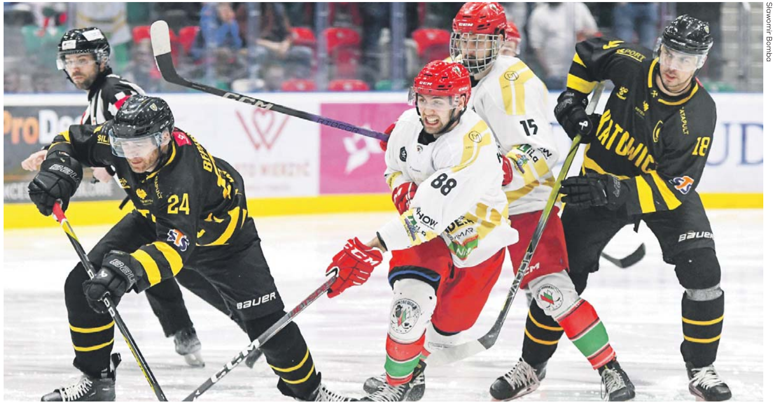
Hokejowe Zagłębie Sosnowiec to pięciokrotny mistrz Polski

Prezes zaznacza, że hokej na lodzie jest bardzo kosztownym sportem. Koszt jednego kija, których w ciągu tygodnia łamie się nawet sześć, to nawet 1500 złotych, a profesjonalnych łyżew – nawet 5000 złotych. Do tego dochodzą koszty utrzymania zawodników czy wyjazdów na mecze. Kluby hokejowe tak jak piłkarskie czy koszykarskie nie mogą liczyć na wielkie pieniądze, nie otrzymują chociażby środków