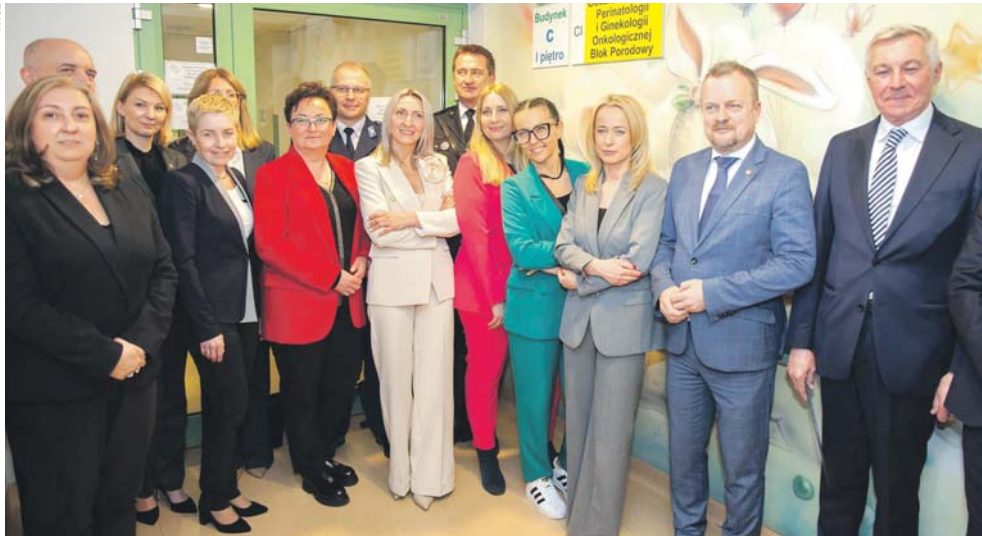
Goście jubileuszu odstonili mural przed Oddziałem Klinicznym Perinatologii i Ginekologii Onkologicznej.