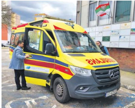
Karetka obsługuje nie tylko mieszkańców Milowic, ale też Pogoni i Starego Sosnowca

Dzięki nowej podstacji w Milowicach czas dotarcia do pacjenta czy osoby poszkodowanej będzie jeszcze szybszy.