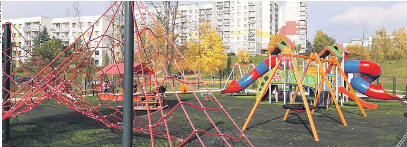
W ramach BO udało się rozbudować i zmodernizować plac zabaw między ul. Norwida, Rodakowskiego i Witkiewicza.

25 spośród 113 projektów poddanych pod głosowanie doczeka się realizacji w ramach X edycji Budżetu Obywatelskiego już w przyszłym roku.