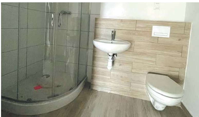
Łazienki zostały wyposażone w prysznice lub w wanny i toalety.

wniosku o zawarcie umowy najmu mieszkania nie może być niższy niż 200 proc. najniższej emerytury w gospodarstwie jednoosobowym lub 150 proc. najniższej emerytury w gospodarstwie wieloosobowym. Średni miesięczny dochód gospodarstwa domowego w roku poprzedzającym rok, w którym jest zawierana umowa najmu lokalu mieszkalnego, nie może przekraczać wysokości, o której mowa w art. 7a ust. 1 pkt 2 ustawy z dnia 8 grudnia 2006 r. o finansowym wsparciu niektórych przedsięwzięć mieszkaniowych (t. j. Dz. U. z 2023 r. poz. 788 ze zm.). Starający się nie może posiadać tytułu do lokalu mieszkalnego położonego na terenie Sosnowca, a w przypadku posiadania takiego tytułu składa oświadczenie, że do dnia podpisania umowy najmu wyzbędzie