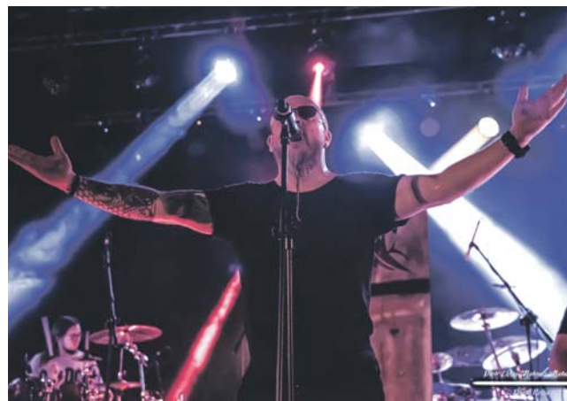
Na scenie w Kazimierzu zagra m.in. Post Profession.