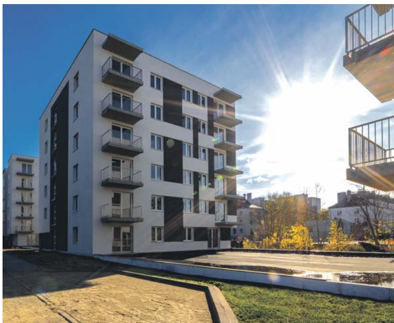
Tak prezentuje się nowe osiedle przy ul. Naftowej.

O mieszkanie w nowych blokach ubiegać się będą mogli osoby, które spełnią opracowane na tę okazję specjalne kryteria. Średni miesięczny dochód przypadający na członka gospodarstwa domowego osoby ubiegającej się o mieszkanie za ostatnie trzy miesiące poprzedzające miesiąc złożenia