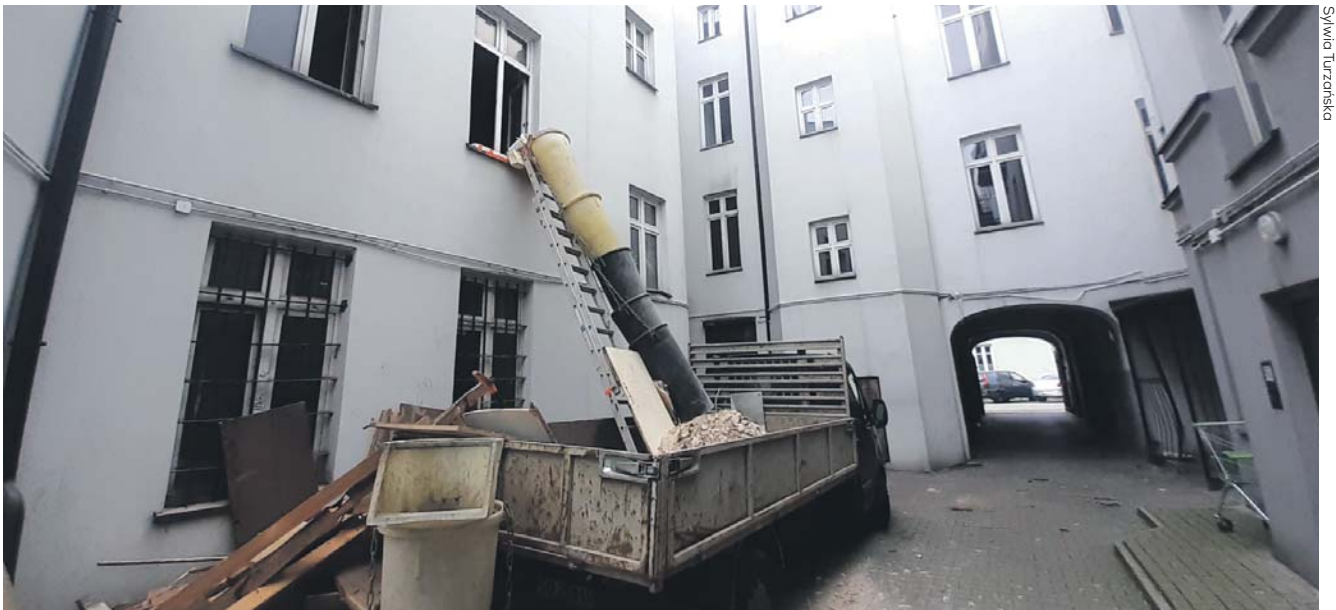
Trwa remont pustostanów przy ul. Targowej 18.

Okolo 650 mieszkań, które do tej pory były pustostanami, w ciągu ostatnich czterech lat trafiło do mieszkańców Sosnowca.