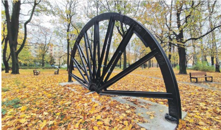
Upamiętnienie kopalni Milowice.