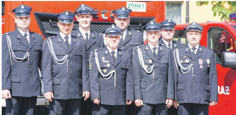
Strażacy z sosnowieckiego zakładu zajmują się dziś głównie prewencją.

W 1996 po podziale dawnej Premy-Milmet i przejściu części łóżyskowej przez koncern The Timken Company straż zyskuje nazwę Zakładowa Ochotnicza Straż Pożarna Tim-