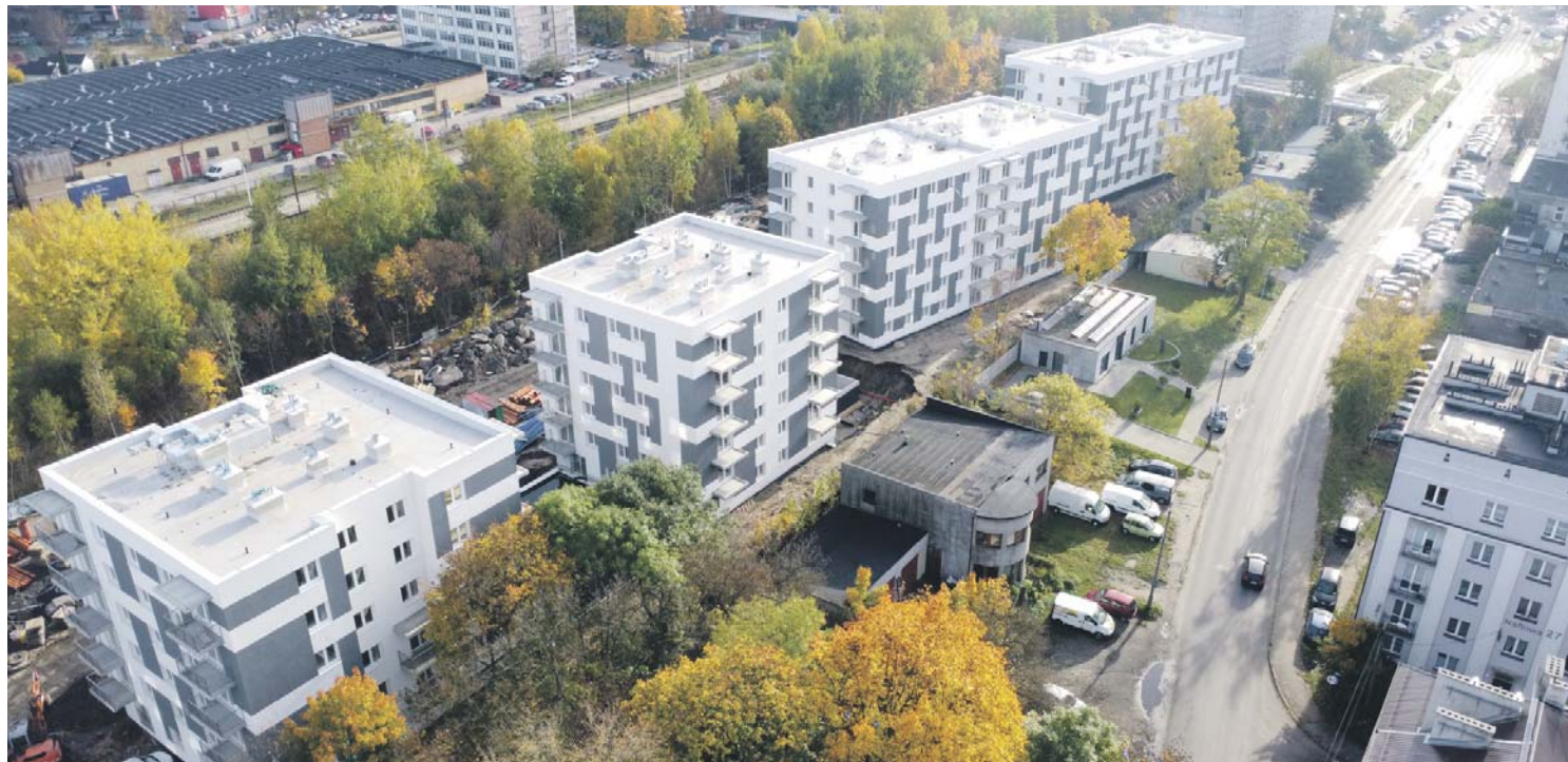
Nowe osiedle powstało przy ul. Naftowej, w rejonie dworca Sosnowiec Południowy.

Koszt inwestycji to około 100 milionów złotych, z czego ponad 25 procent środków prze-