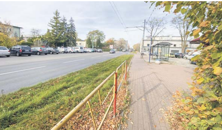
Pracowni UM w Sosnowcu

Nowe rondo poprawi komunikację oraz płynność jazdy. Łatwiej będzie wyjechać z prowadzącej od Centrum Pediatrii wyremontowanej już ulicy Zapolskiej. Co ważne, przy szpitalu powstały również nowe miejsca par-