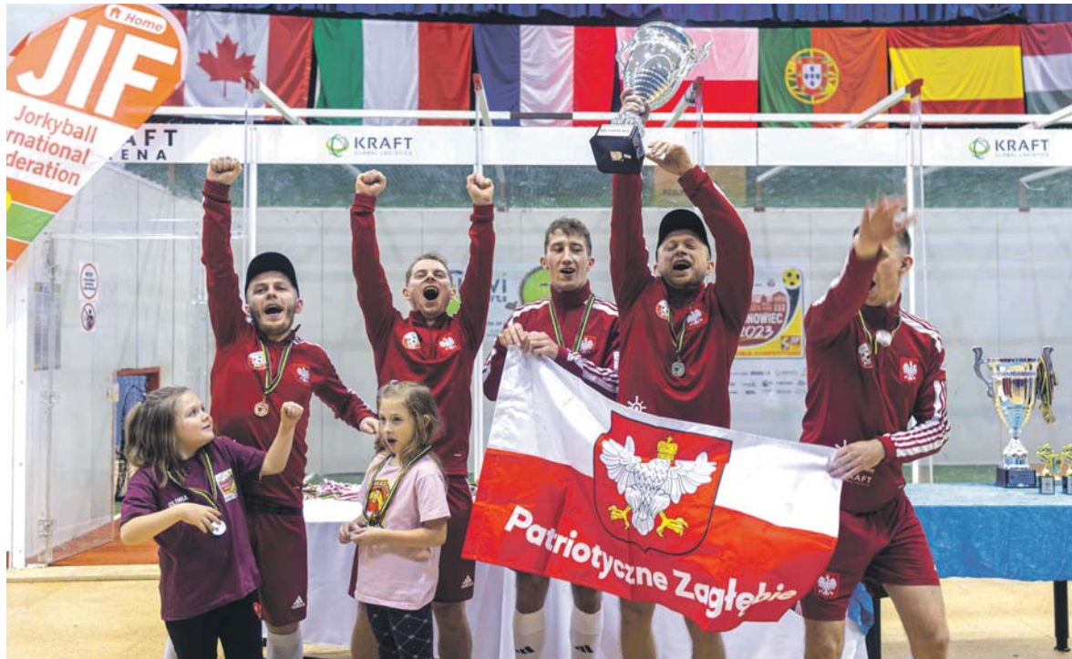
W hali w Sosnowcu-Zagórze reprezentacja Polski oparta na zawodnikach Jorkyball Sosnowiec sięgnęła po tytuł wicemistrzów świata.

To nie przypadek, że impreza tej rangi odbyła się w naszym mieście. To właśnie w Sosnowcu w 2009 roku powstało pierwsze w Polsce boisko do jorkyballa. Klub z Sosnowca (bo-