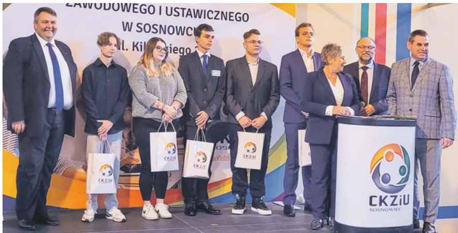
CKZiU podczas imprezy nagrodziło swych najlepszych uczniów.