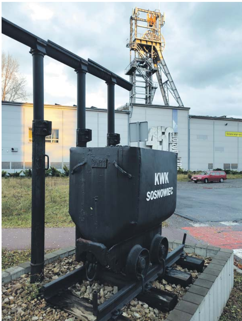
Upamiętnienie kopalni Sosnowiec. W tle widoczna jest wieża wyciągowa szybu Anna – obecnie Sport Poziom 450.

działalności zakład wydobyl 124 mln ton węgla. Do najważniejszych pamiątek pozostałych po kopalni należy wieża wyciągowa wraz z nadsztybem szybu Anna, symboliczny wóz (wagonik), tablica pamiątkowa oraz budynek dawnego laboratorium kopalnianego przy ulicy gen. Andersa 1. Jest i jeszcze budynek dawniej kopalnianej elektrowni. Niestety, stan w jakim się znalazł, woła o pomstę do nieba. W wyniku dość specyficznej „zabudowy” dokonanej przez właściciela został zszpecony i utracił swój wyjątkowy charakter.