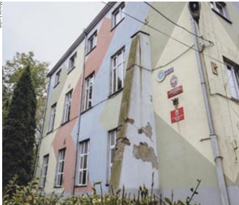
Budynek przy ul. Władysława Warneńczyka przejdzie metamorfozę.

rowych oraz konstrukcji, projektowania i modelowania. Nie zabraknie też miejsca na kreatywne studio mody i stylizacji. Zakupione zostaną także maszyny, sprzęt, urządzenia tech-