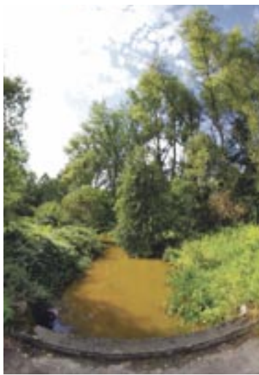
Zagórka Żółta Rzeka. Zdjęcie z sierpnia 2014.

Kontynuujemy wędrówkę. Droga biegnie lekko pod górę. Stopniowo