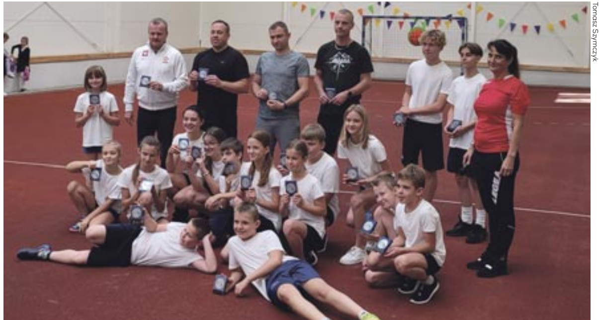
Koszt budowy nowej hali wyniósł 8,4 mln zł.