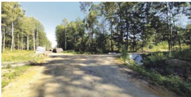
Droga na wprost prowadzi w kierunku stawu Smug. Kierując się w prawo, dojdziemy do Czarnego Morza.