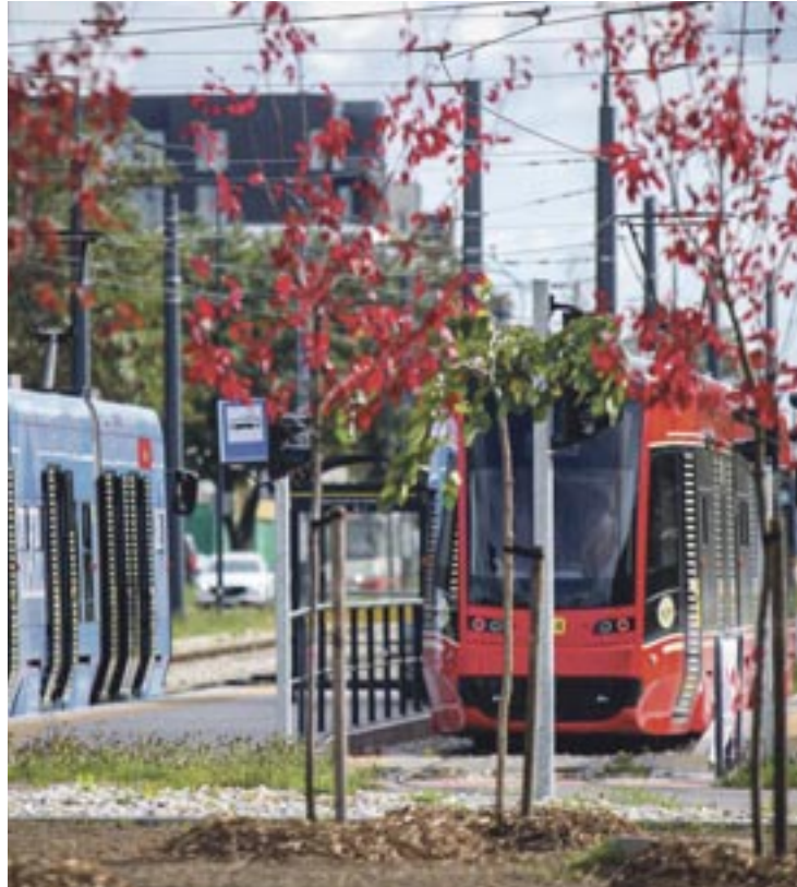
Nowe drzewa pojawiły się m.in. na rondzie Jana Pawła II.

Nasadzenia do grudnia wykona spółka Markflor z Krakowa. Zgodnie z postanowieniami zawartej umowy drzewa muszą mieć w obwodzie przynajmniej 14 cm na wysokości jednego metra. Wszystkie prace będą kosztować ok. 1,4 mln zł, a co więcej wykonawca musi pielęgnować drzewa i krzewy w okresie trzech lat od ich nasadzenia.