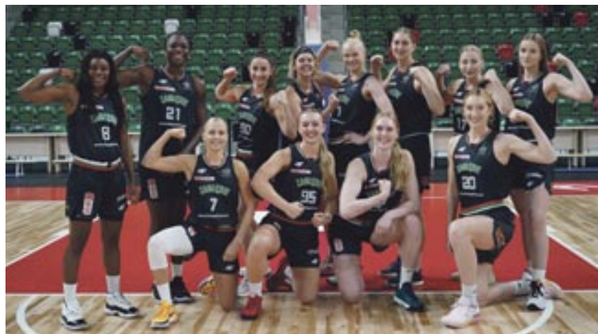
Czwarty zespół ubiegłego sezonu kapitalnie rozpoczął kolejną kampanię w OrlenBasket Lidze Kobiet.