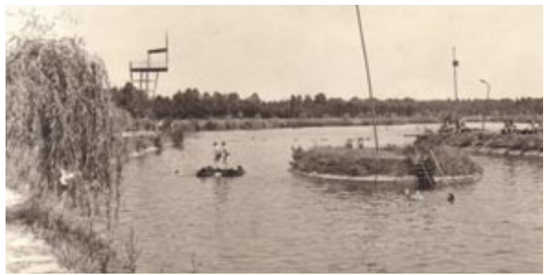
Staw Leśna na archiwalnym zdjęciu udostępnionym przez portal 41-200. pl. Obecnie pomiędzy wyspą a wieżą znajduje się mostek.

nikną zabudowania. Najpiękniej jest tutaj jesienią, gdy drzewa dosłownie kipią wszelkimi odcieniami żółci i czerwieni. Mijamy wylot jednej z licznych przecznicy ulicy Nowej. Las nieco się przerzedza. To efekt prowadzonych trzebieży. Docieramy do niepozornego skrzyżowania, na którym skręcamy w prawo. Podążamy za ścieżką, która stopniowo przeradza się w drogę. Las po lewej stronie skrywa relikty szybu Kazimierz IV – jednego z szybów peryferyjnych kopalni Kazimierz. Szyb ten został zgłębniony w 1902 roku i miał głębokość 159 m. Niedaleko od drogi znaleźć można fundamenty zastrzałów wieży szybowej z zachowanymi górniczymi symbolami oraz hałdy. Jak przystało na dzielnicę, która w swej nazwie ma przymiotnik „górnicy”, takich pamiątek znajdziemy w Kazimierzu dużo więcej. Zachęcam do ich odnajdywania i poznawania. Póki co skupimy się jednak na dotarciu do punktu docelowego wycieczki, czyli do najwyższego z sosnowieckich parków, który również związany jest górnictwem przeszłością Kazimierza.