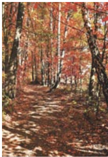
Czerwona ścieżka pomiędzy Czarnym Morzem a szymbem Kazimierz IV.