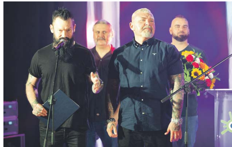
... oraz grającą metal sosnowiecką grupę Frontside.