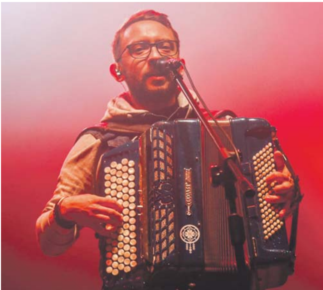
Podczas pikniku wystąpią zespoły Enej (na zdjęciu) i Habakuk.