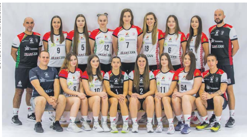
Siatkarki Płomienia ubiegły sezon zakończyły na trzecim miejscu w I lidze. W bieżącym sezonie klub z Sosnowca także chciałby znaleźć się w najlepszej czwórce rozgrywek.

Na inaugurację rozgrywek siatkarki I-ligowego Trans-Ann Płomienia Sosnowiec uległy na własnym parkiecie drużynie MKS SAN-Pajda Jarosław 1:3. W najbliższy weekend nasz zespół czeka wyjazdowy pojedynek, ale w trzy kolejne soboty października zapraszamy do hali w Miłowicach.