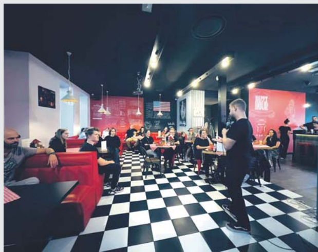
orc Sosnowiec łączy