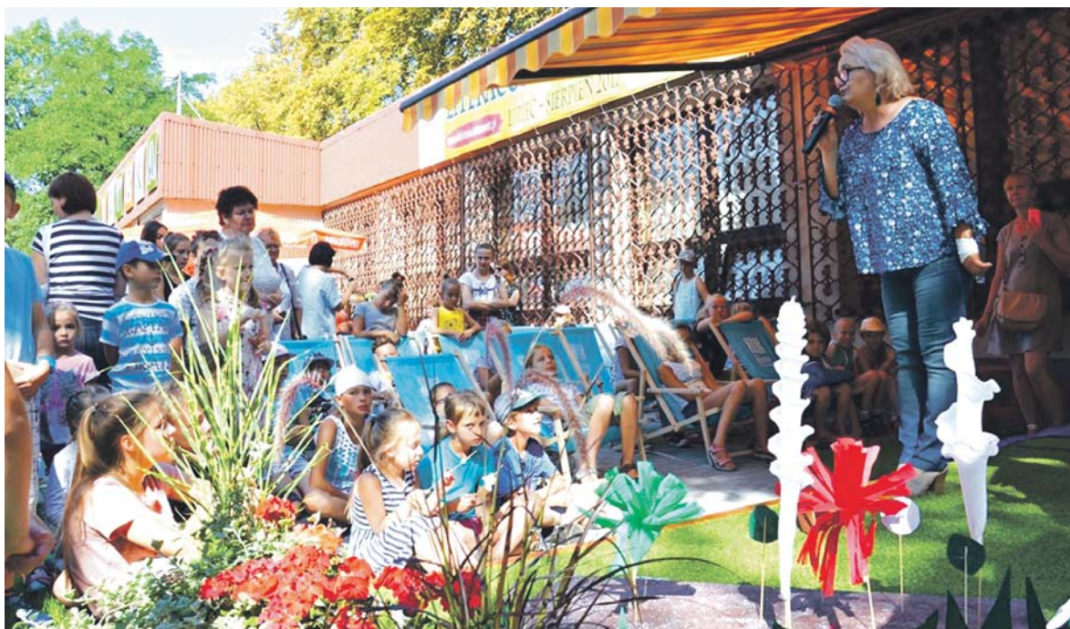
W ramach BO udało się m.in. wyremontować i zagospodarować taras przy filii biblioteki na Starym Sosnowcu.

Projekty zgłoszone w X edycji zostały sprawdzone przez zespół konsultacyjny zarówno pod kątem formalnym, jak i merytorycznym. Urzędnicy sprawdzili m.in. rzetelność wyceny kosztów projektu, możliwość jego realizacji na wskazanym obszarze ze względu na kwestię własności nieruchomości, gdzie projekt ma być wykonany i jego przeznaczenie w miejscowym planie zagospodarowania przestrzennego, wysokość kosztów utrzymania, unikalność i realną potrzebę realizacji określonego pomy-