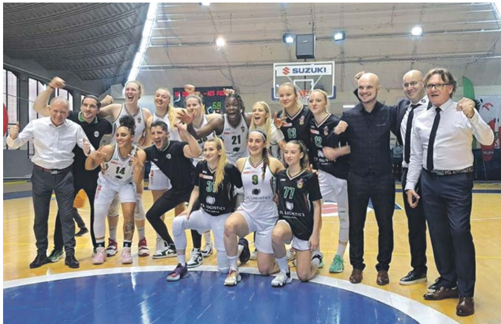
Przed koszykarkami MB Zagłębie wyjątkowy sezon. Oby powodów do radości było w nim jak najwięcej, tak jak miało to miejsce w minionych rozgrywkach, gdy zespół z Sosnowca okazał się czwartą siłą w Polsce.