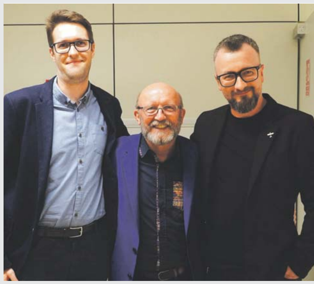
orc MPB w Sosnowcu