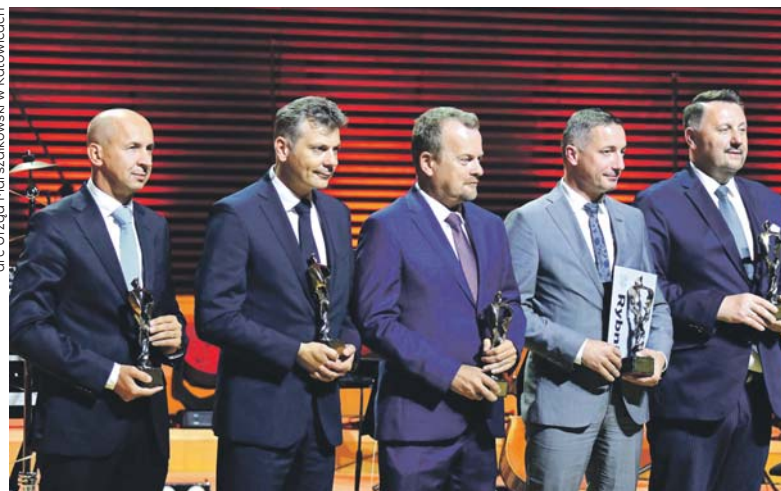
Statuetka Superprezydenta trafiła m.in. do prezydenta Sosnowca.

Mija ćwierć wieku od reformy administracyjnej kraju, która zamiast czterdziestu dziewięciu, wprowadziła szesnaście województw. W gmachu Narodowej Orkiestry Symfonicznej Polskiego Radia w Katowicach odbyła się uroczysta gala z okazji 25-lecia województwa śląskiego.