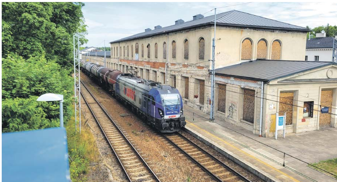
Dworzec kolejowy w Maczkach to bezcenna, choć niszcząca pamiątka po Kolei Warszawsko-Wiedeńskiej.