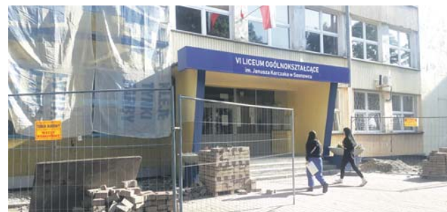
W VI LO im. J. Korczaka rozpoczęła się już termomodernizacja.

Szeroki zakres prac, obejmujący m.in. renowację parkietów i podłóg, malowanie sal lekcyjnych oraz zaplecza kuchennego, modernizację instalacji hydrantowej, remont łazienek, korytarzy, a także chodników umożliwiających bezpieczne dojście do szkół i przedszkoli, udało się zrealizować podczas wakacji w przedszkolach nr 11, 34, 44, 39, SP nr 18, II LO im. E. Plater oraz ZSEiI w Sosnowcu. Prace w tych placówkach zostały już zakończone. Ze względu na to, że kilka umów zostało zawartych w sierpniu, remonty trwają jeszcze w trzech szkołach podstawowych, czyli SP nr 8, 32, 39 oraz w trzech przedszkolach – PM nr 31, 38 i 44. Wszystkie prowadzone prace w tych placówkach powinny zakończyć się w ciągu najbliższych tygodni. Remontowane są w nich głównie szkolne pomieszczenia, sale lekcyjne, jak również chodniki i ogrodzenia wokół placówek. Koszt tegorocznych wakacyjnych remontów w szkołach i przedszkolach wyniesie około 1 815 000 złotych. Dzięki tym inwestycjom podopieczni przedszkoli będą bawić i uczyć się, a uczniowie zdobywać wiedzę w lepszych warunkach.