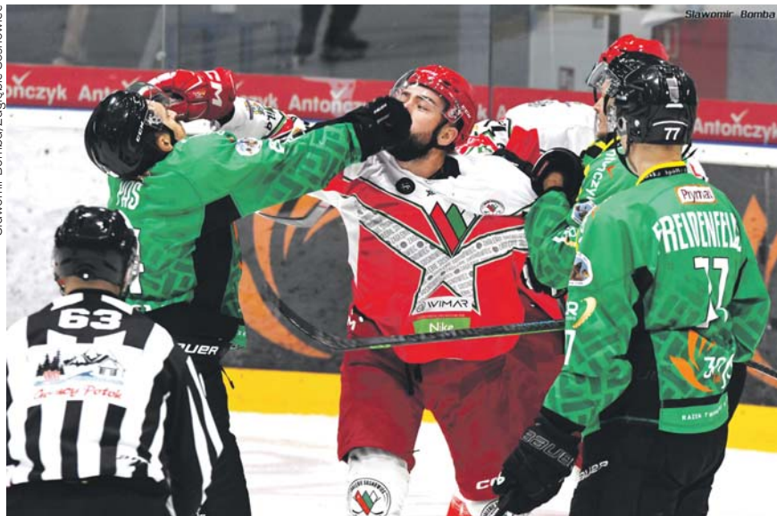
Przed Zagłębiem wyjątkowy sezon. Walki na lodzie – dostownie i w przenośni – na pewno nie zabraknie.

Nowa spółka, nowy prezes, a przede wszystkim nowy dom dla hokeistów, jakim od niedawna zostało najnowocześniejsze w Polsce lodowisko wchodzące w skład Zagłębiowskiego Parku Sportowego. 10 września rozgrywki wznawia Tauron Hokej Liga, a tym samym na lód wracają hokeiści Zagłębia Sosnowiec, którego kadra została istotnie zmieniona.