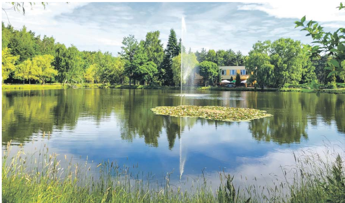
Trasa wycieczki przebiega m.in. przez Park im. Jacka Kuronia w Kazimierzu Górniczym.

Z Juliusza wyjeżdżamy ulicą Łazienną pod wiaduktem dawnej kolejki wąskotorowej łączącej ruchy Kazimierz i Juliusz. Leśną drogą dojeżdżamy do terenu dawnej stacji towa-