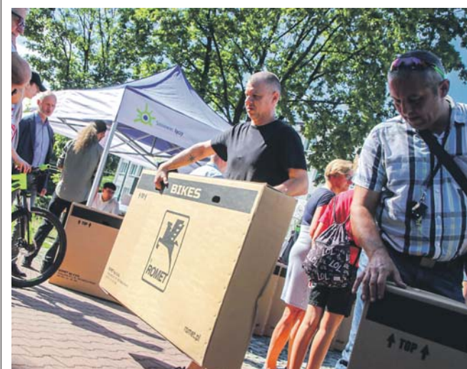
Nagrodami w loterii były rowery trekkingowe.

Trzy i pół tysiąca osób zdecydowało się w tym roku na udział w kolejnej edycji „Loterii PIT – rozlicz podatek w Sosnowcu”. W poniedziałek 4 września zwycięzcy loterii odebrali swoje nagrody. To dwadzieścia rowerów trekkingowych. – Loteria to forma podziękowania dla