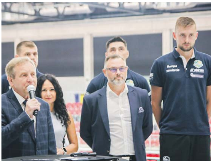
Zawarta umowa przewiduje możliwość rozegrania siedmiu meczów.