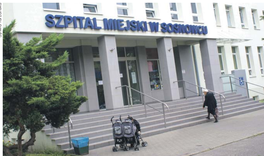
Środki na bezpłatne badania dla pięćdziesięciolatek pochodzą z budżetu miasta.

Bezpłatne badania profilaktyczne w kierunku wykrycia markerów nowotworowych mogą zrobić sosnowiczanie, którzy w tym roku obchodzą swoje 50. urodziny. Badania są darmowe i będzie można z nich skorzystać jednorazowo od 1 września do 31 grudnia tego roku w Szpitalu Miejskim w Sosnowcu przy ul. Zegadłowicza 3. Badania będą wykonywane w budynku B