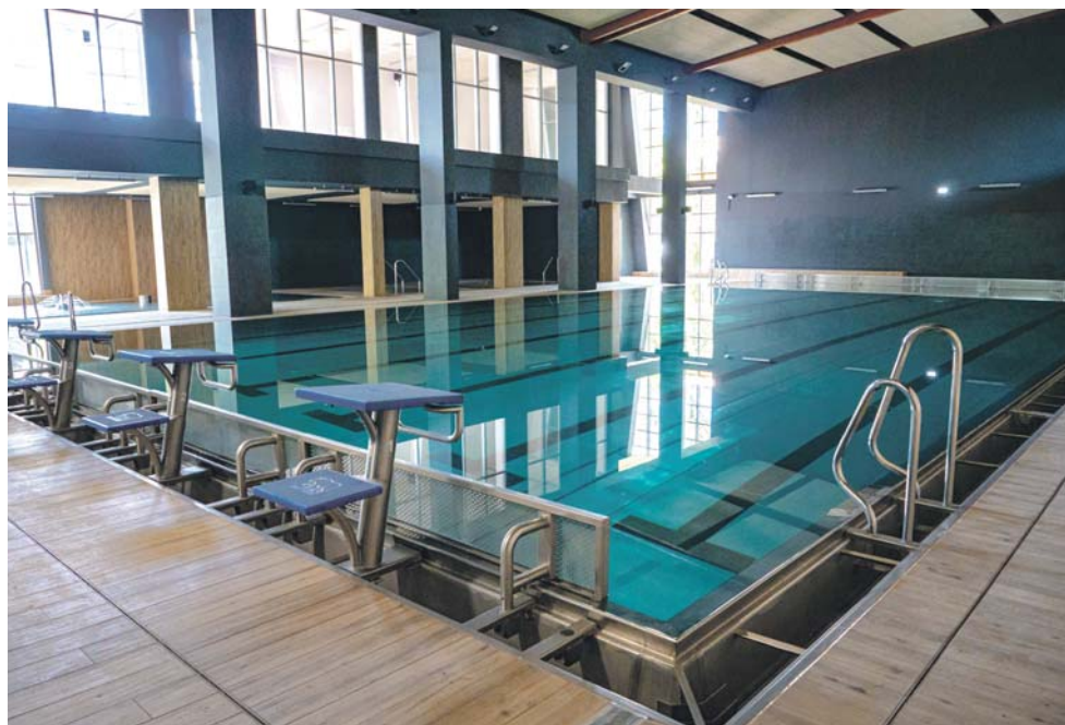
Z wejściówek będzie można korzystać m.in. w ŻeromParku.

Pakiet Sportowy to cztery jednorazowe godzinne bezpłatne bilety wstępu do wybranych