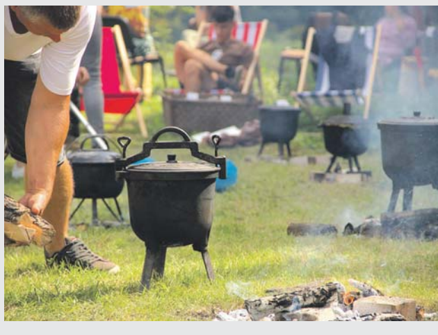
arc POK Maczki

• Przystanek Otwartej Kultury Maczki zorganizował konkurs Maczkowskie Pieczonki. Drużyny rywalizowały o miano tej, która przygotowała najsmaczniejszą wersję tego zagłębiowskiego przysmaku.