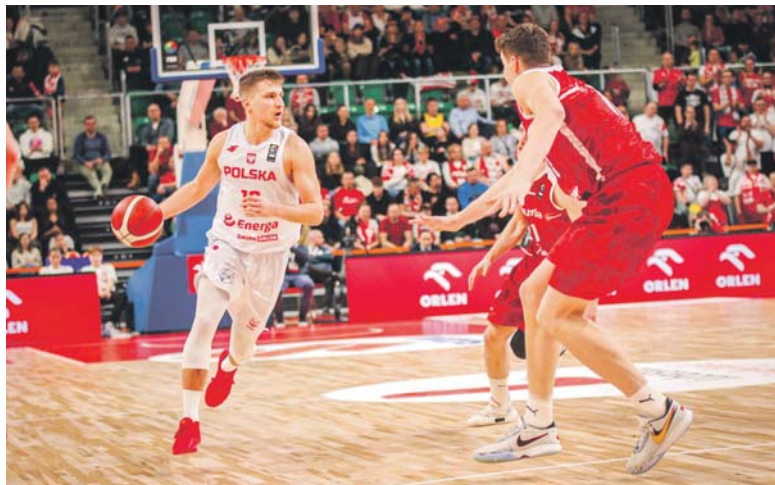
W Arenie Sosnowiec rywalizowała już m.in. koszykarska reprezentacja Polski mężczyzn. Teraz pora na najlepsze drużyny ligowe w kraju.

– Nowy sezon ORLEN Basket Ligi zapowiada się ekscytująco, a jeszcze dzień przed jego oficjalnym rozpoczęciem tradycyjnie rozegramy spotkanie o Pekao S.A. Superpuchar Polski. Dla Kinga Szczecin i Trefla Sopot będzie to więc okazja do zdobycia prestiżowego trofeum im. Adama Wójcika. Starcie tych drużyn to gwarancja wielkich