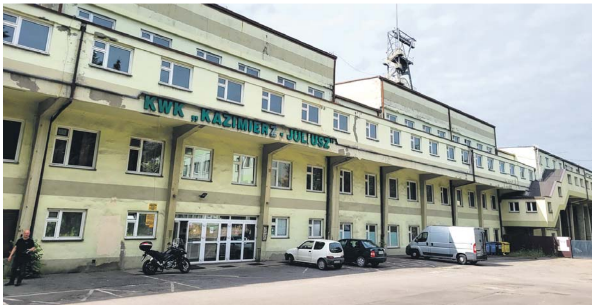
Część zachowanych budynków po kopalni Kazimierz-Juliusz jest dziś własnością miasta.

rowej w Maczkach, pozostałością po której jest olbrzymi wiadukt na trasie Dorota-Jezor. Patrząc na jego rozmiary, można sobie wyobrazić, ile było tu kiedyś torów. Tuż przed stacją po prawej stronie mijamy miejsce po dawnym szybie wentylacyjnym Maczki.