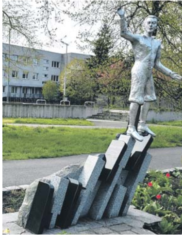
W Parku Sieleckim stoi rzeźba Jana Kiepusy.

Wróćmy jednak na Pogoń, bo nie brakuje tu innych miejsc związanych z Kiepurą. Majowa 6 nie była pierwszym adresem Kiepurów w Sosnowcu. Nim na świat przyszedł mały Janek, mieszkali w rejonie dzisiejszej siedziby Wydziału Filologicznego Uniwersytetu Śląskiego przy ul. Grota-Roweckiego. Niedaleko stamtąd do dawnego gmachu Szkoły Realnej, a dziś siedziby Sądu Okręgowego, a w przeszłości siedziby Gimnazjum im. Stanisława Staszica (naturalnie, do dziś funkcjonującego jako IV LO), którego absolwentem jest właśnie Kiepusa. Warto wspomnieć również o dzisiejszej ulicy Curie-Skłodowskiej. Trudno to so-