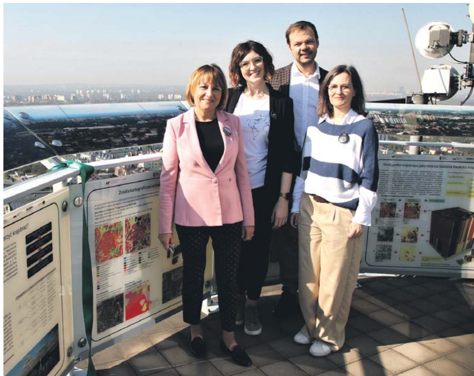
Pracownicy Zespołu Badań Krajobrazu prezentują Stację Czytania Krajobrazu.

– To wyspecjalizowana pracownia do analiz krajobrazu, przeznaczona dla osób studiujących geografię na specjalności monitoring zmian krajobrazu, ale służąca także szerokiemu gronu studentów, doskonalących swe kompetencje w zakresie nowoczesnej kartografii i Geograficznych Systemów Informacyjnych (GIS) na kierunkach prowadzonych