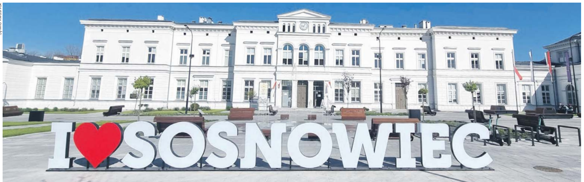
Napis I love Sosnowiec pojawił się na placu Powstańców Styczniowych przed dworcem Sosnowiec Główny. Instalacja spotkała się z zainteresowaniem mieszkańców. Sporo osób robi sobie przy niej zdjęcia.

możliwe będzie również dołączenie papierowej listy podpisów. Zgłaszając projekt, trzeba zacząć od tytułu i opisu projektu, a także podać szacunkowy koszt i dokładną lokalizację z ulicą i numerem działki. Konieczne będą również dane zgłaszającego. Kolejne etapy to lista poparcia (minimum 15 osób dla projektu ze strefy i 30 dla ogólnomiejskiej), uzasadnienie projektu oraz niezbędne oświadczenia i zgody. Ciąg dalszy na str. 3