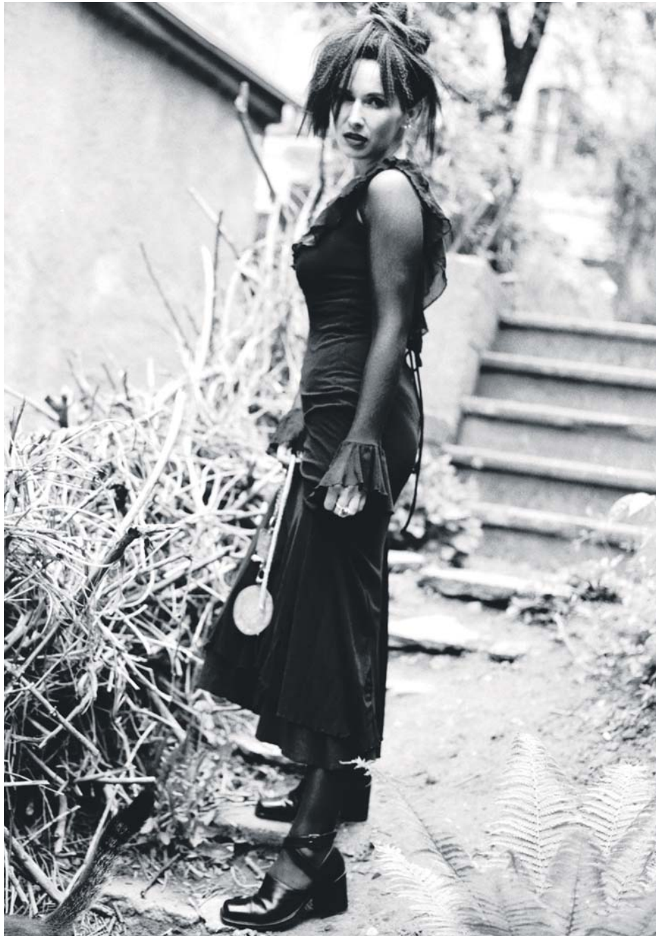
Autorem zdjęcia jest Jacek Poremba, który na wystawie „Wszystkie twarze Kory” zaprezentuje unikatowe zdjęcia artystki.

Więcej informacji można znaleźć na stronie: www.biblioteka.sosnowiec.pl i w mediach społecznościowych Mediateki. Warto śledzić media społecznościowe: Facebook, YouTube, Instagram, Twitter, TikTok. Patronat nad imprezą objął m.in. Kurier Miejski.