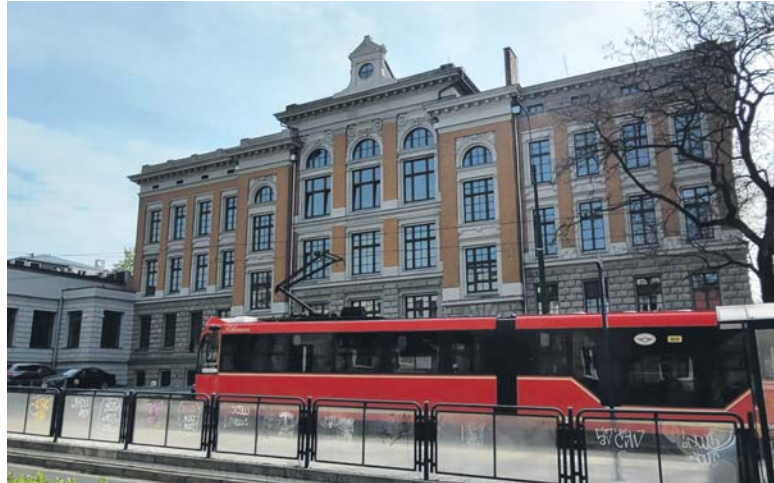
W dzisiejszej siedzibie Sądu Okręgowego mieściło się Gimnazjum im. S. Staszica, którego absolwentem jest śpiewak.

Obok boisk przy al. Mireckiego też nie brakuje miejsc związanych z Kiepurą. Niedaleko stąd na ulicę Jana Kiepusy, jak w październiku 1981 roku Miejska Rada Narodowa nazwała ulicę Miłą, przy której funkcjonowała piekarnia Lech prowadzona przez rodziców artysty. Kamienicy Kiepurów już nie ma, chociaż stała jeszcze, gdy w latach sie-