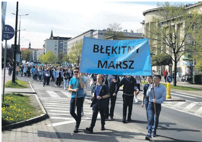
Michał Wiśniewski, który wziął udział w Błękitnym Marszu, przekonywał uczestników, że warto pomagać chorym na autyzm i zespół Aspergera.

– Bądźcie uśmiechnięci i realizujcie się w życiu, ale pamiętajcie, że wśród nas są osoby, które trzeba wspierać. Często są to osoby bardzo zdolne i potrafią robić rzeczy wielkie. Dziękuję Michałowi Wiśniewskiemu, że zaszczylił swoją obecnością tę inicjatywę i dziękuję też wszystkim organizatorom Błękitnego Marszu – powiedział do uczestników imprezy prezydent.