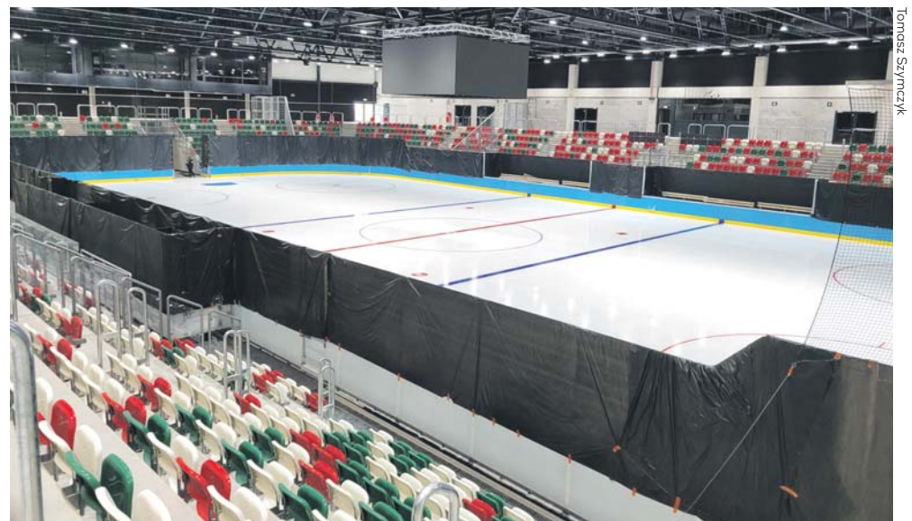
Trzeci obiekt ZPS, czyli lodowisko, jest już gotowe i niebawem zostanie oddane do użytku.

Zakończyły się prace związane z budową nowego lodowiska wchodzącego w skład Zagłębiowskiego Parku Sportowego. Chociaż w obiekcie trwa jeszcze faza odbiorów inwestorskich, to można już powiedzieć, że ArcelorMittal Park składa się z trzech nowoczesnych obiektów sportowych.