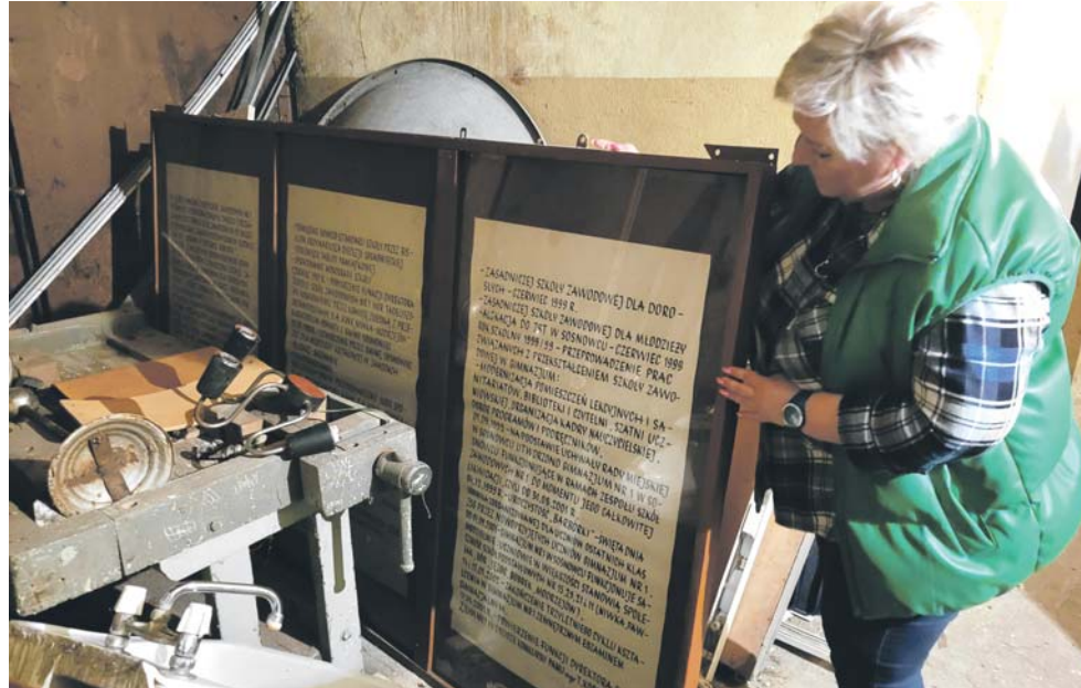
Izba pamięci kopalni Niwka-Modrzejów powstaje w dawnej szkole górniczej na Niwce.

Szkoła Podstawowa nr 15 od wielu lat działa w budynku przy ul. Wojska Polskiego, ale korzysta z sali gimnastycznej i obiektów sportowych