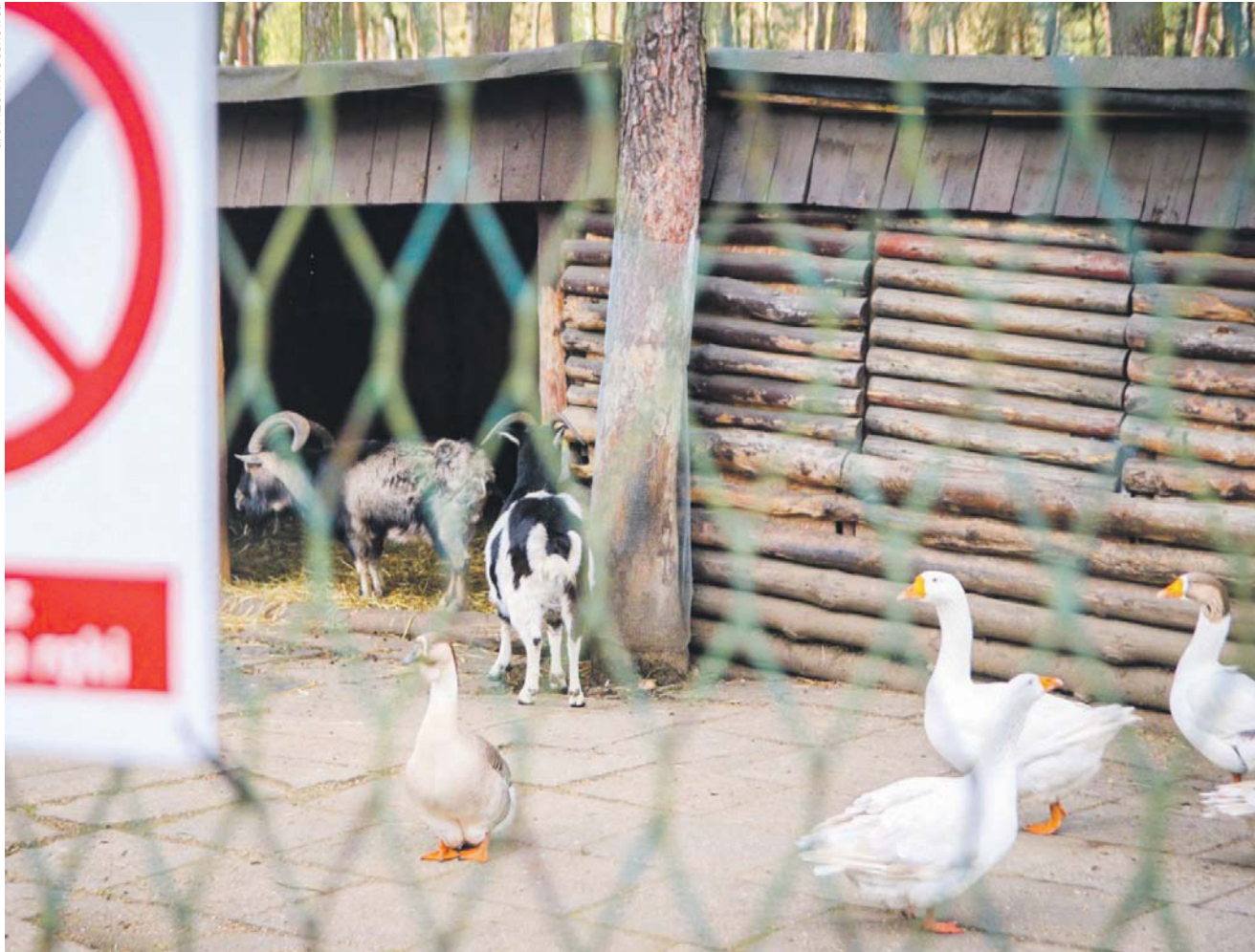
W minizoo można zobaczyć m.in. kozy, daniela, kaczki czy gęsi.

W minizoo w parku im. Jacka Kuronia w Kazimierzu Górniczym trwa instalacja szesnastu kamer. Urządzenia będą podglądać nie tylko zwierzęta, ale i... odwiedzających po to, by zapobiec sytuacjom, które mają negatywny wpływ na życie podopiecznych minizoo.