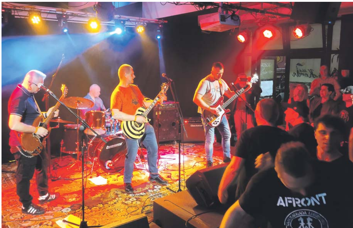
Grupa Czterdzieści Jeden Dwieście jubileusz świętowała w Komin Music Cafe.

Swoją jubileuszową grupę postanowiła świętować oczywiście koncertowo. W sobotę 18 marca w sosnowieckim klubie Komin Music Cafe zagrała razem z formacjami Zbeer i Sedes. Nie