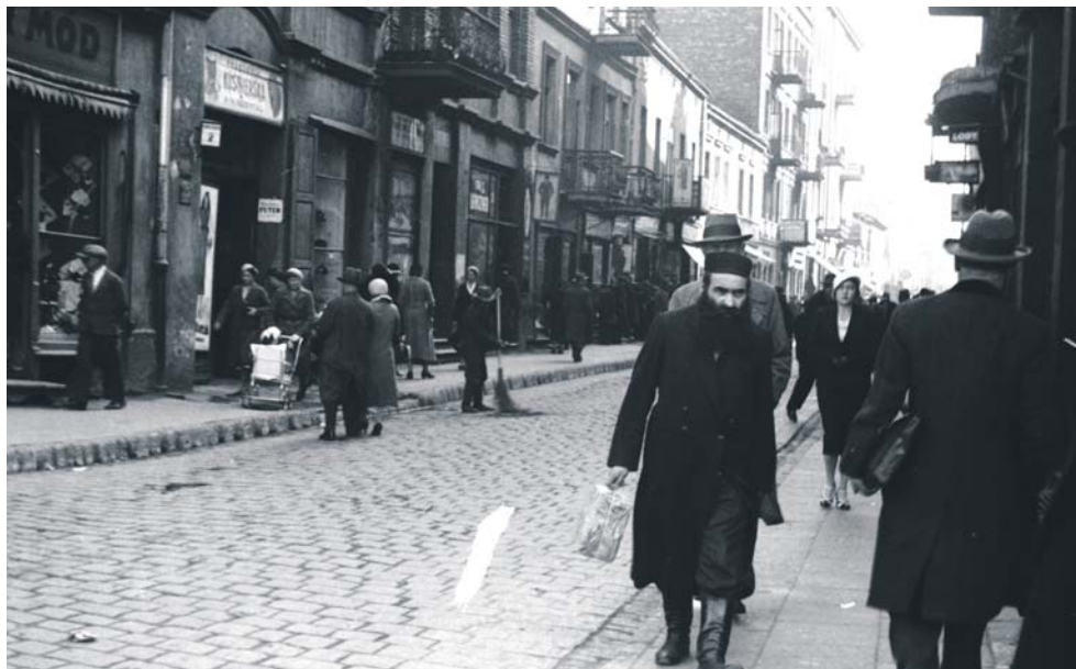
Jedna z sosnowieckich ulic w latach 30. XX wieku.