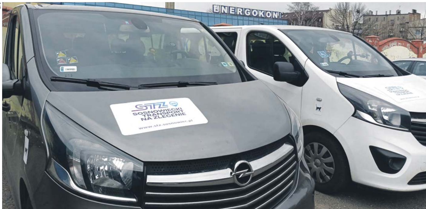
Kurs nocny można zamówić za pomocą specjalnej aplikacji.

Już nie tylko z przystanków obsługiwanych przez tramwaje linii nr 24, 26 i 27 będzie można korzystać w ramach komunikacji nocnej w Sosnowcu. Od początku kwietnia usługę w ramach Sosnowieckiego Transportu na Zlecenie zamówić będzie można również do przystanków w takich dzielnicach jak Zagórze, Środula, Ostrowy Górnicze czy Maczki.