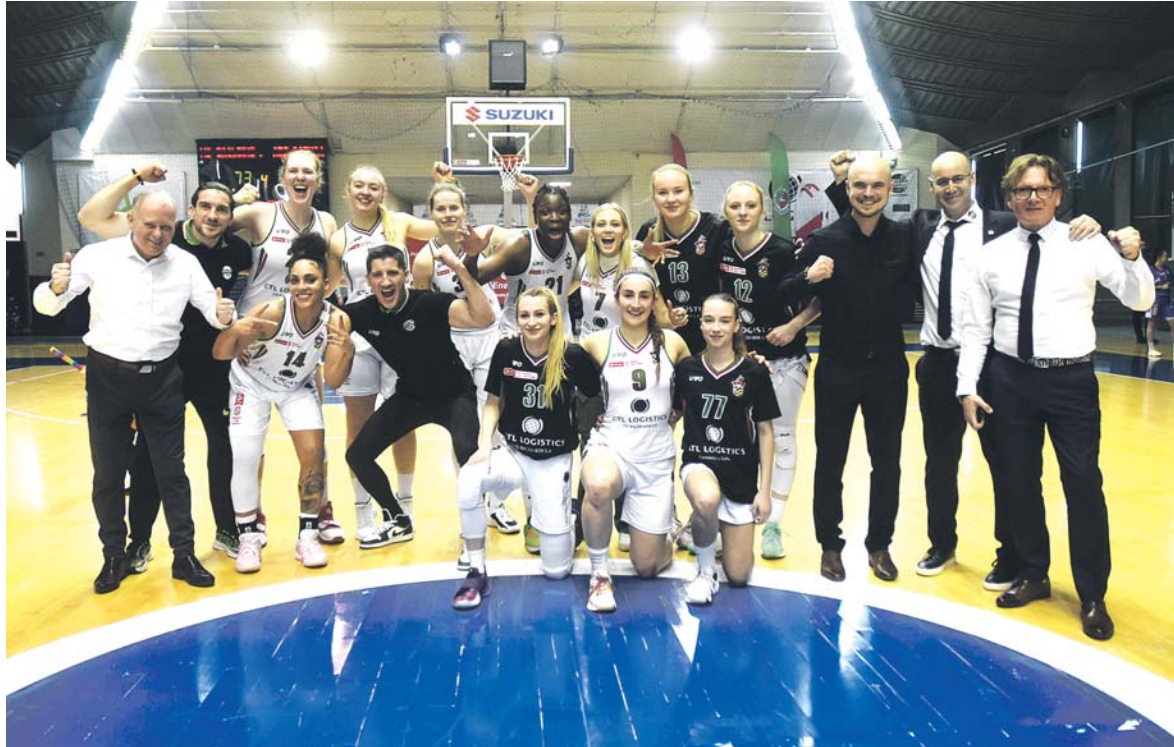
Koszykarki MB Zagłębie mają powody do radości. Już zanotowały historyczny wynik, a teraz powalczą o pierwszy w historii medal.