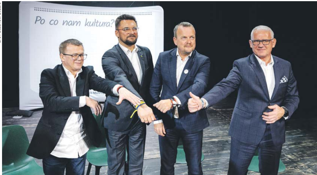
arc Astashow Studio

Czy w 2029 roku Europejską Stolicą Kultury zostanie Górnośląsko-Zagłębiowska Metropolia? Są na to spore szanse, ponieważ Katowice i Sosnowiec, przy wsparciu innych miast Metropolii, wspólnie pracują nad wnioskiem aplikacyjnym. Dokument musi być gotowy do połowy września. Wówczas trafi pod ocenę Ministerstwa Kultury i Dziedzictwa Narodowego, które wybierze najlepszą aplikację spośród złożonych przez polskie miasta.