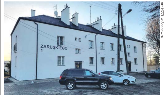
Prace zakończyły się już m.in. w budynku przy ul. Zaruskiego 1.

– Działamy cały czas, a efekty są naprawdę duże. W 8 lat zlikwidowaliśmy 6500 pieców. To efekt inwestycji w termomodernizację, ale też licznych dopłat do likwidacji tzw. kopciuchów. Dzięki temu, liczba dni z przekroczeniami pyłu zawieszzonego spadła ze 106 w 2013 roku, do 12 w 2022 roku. To nasz powód do dumy – dodaje prezydent Sosnowca. ros