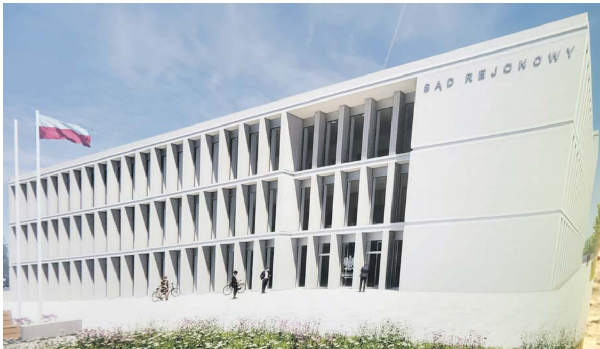
Tak ma się prezentować nowa siedziba sądu przy ul. Kombatantów.

Ten plan właśnie się ziszcza, bo w piątek 17 marca na terenie po KWK Sosnowiec, gdzie już dzisiaj pracują prokuratura i Komenda Miejska Policji, a budowana jest nowa siedziba Rejonowego Pogotowia Ratunkowego, wmurowano akt erekcyjny