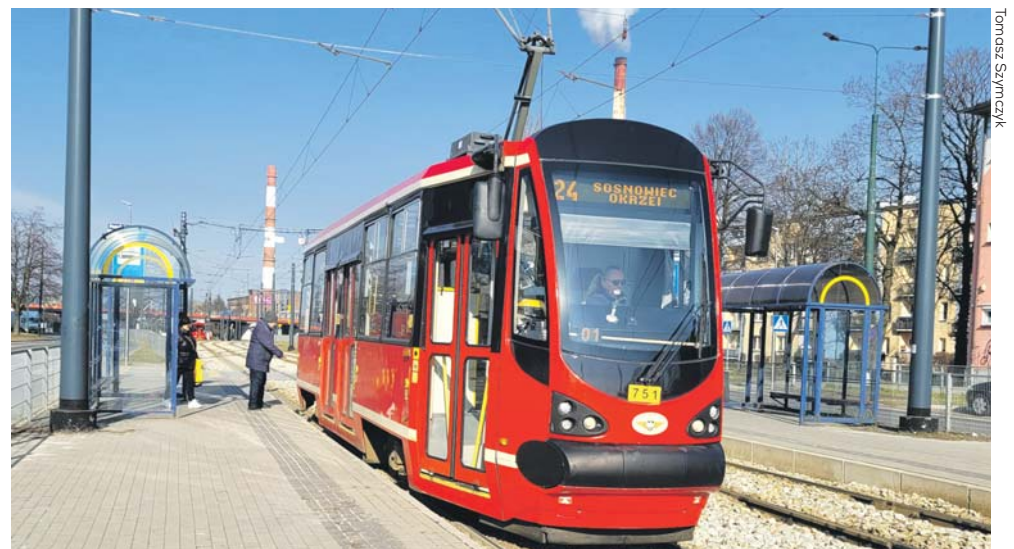
Tramwaj nr 24 kursuje od trójkąta przy ul. Okrzei do pętli przy ul. Będzińskiej.

Od poniedziałku 20 lutego na trasę powróciły tramwaje linii nr 24, których kursowanie było przez kilka ostatnich tygodni zawieszane z uwagi na prace remontowe torowiska w ciągu ul. 1 Maja.