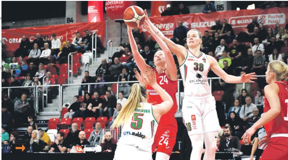
zdjęcia: Mateusz Sobczak/eu.Armagledron, Energobasket Liga Kobiet

Od piątku do niedzieli w nowej hali odbywał się finał Suzuki Pucharu Polski Kobiet.