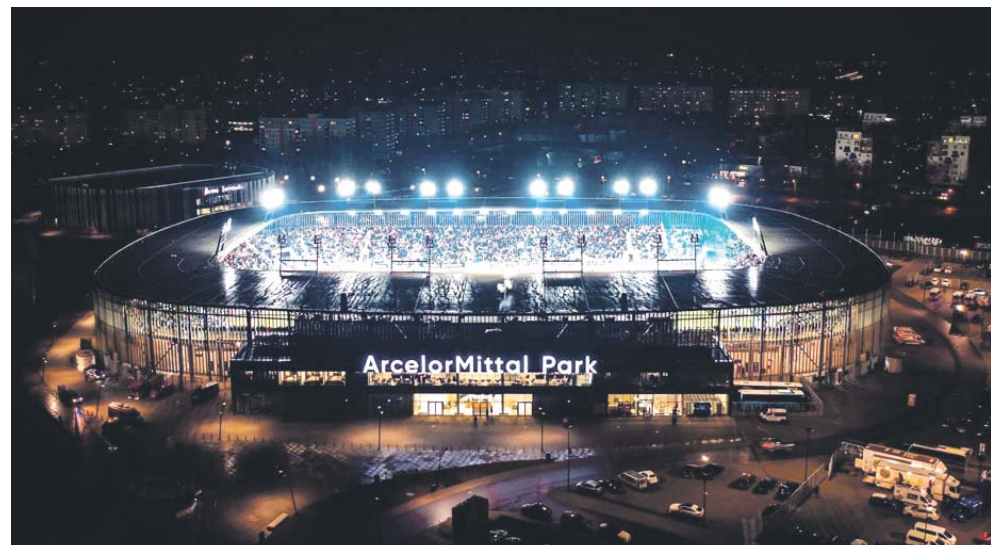
Tak ArcelorMittal Park prezentował się w sobotni wieczór.