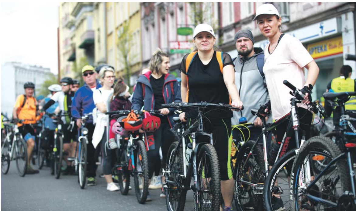
Miłośników jazdy na rowerze w Sosnowcu nie brakuje, o czym świadczy liczba uczestników Zagłębiowskiej Masy Krytycznej.

Przez Sosnowiec mają przebiegać trasy nr 1 oraz 7. Trasa nr 1 na odcinku o długości 3,4 km ma biec od granicy z Katowicami, przez ul. Kresową, planowaną kładką nad ul. Piłsudskiego i do centrum Sosnowca, z wykorzystaniem śladu i nasypu dawnej linii kolejowej. Pozostałe planowane 7,6 km to odnogi „jedyńki” do sąsiadujących miast Zagłębia, włączone pod wspólny numer 7. Jedna z nich ma biec do Czeladzi od ul. Piłsudskiego w Sosnowcu, wzdłuż drogi ekspresowej nr S 86, wiaduktem w ciągu ul. gen. Grotta-Roweckiego, a w granicach Czeladzi odbijając na zachód nieopodal ul. Nowopogońskiej, następnie włączać się w ul. Kościuszki i wracać do Nowopogońskiej śladem starej linii kolejowej. Ta nitka ma się kończyć na DK 94 (ul. Będzińska w Czeladzi). Nie jest wykluczone jednak, że zostanie przedłużona do ul. Wolności