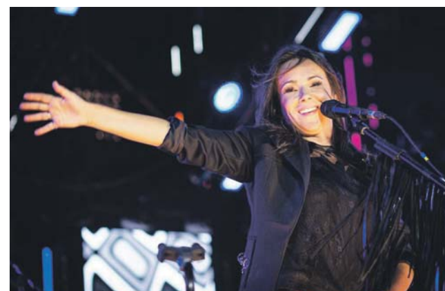
Fani talentu Kasi Kowalskiej nie powinni przegapić jej koncertu.

Jedną z najbardziej znanych i charyzmatycznych postaci na polskiej scenie muzycznej, czyli Kasia Kowalska, wokalistka, kompozytorka i autorka tekstów, już 8 marca wystąpi w Sali Widowiskowo-Koncertowej „Muza”. Jej twórczość od samego początku spotykała się z ogromnym uznaniem zarówno fanów, jak i branży muzycznej. W swoim dorobku posiada wiele prestiżowych nagród, m.in. Fryderyki, Superjedynki, statuetkę MTV European Music Awards „dla najlepszego polskiego artysty” oraz ponad milion sprzedanych płyt. Najświeższe wydawnictwo Kasi Kowalskiej to dwupłytowy album live z festiwalu pol’and’rock 2021. Podczas koncertu nie zabraknie największych przebojów artystki, takich jak: „Prowadź mnie”, „Antidotum”, „A to co mam”, „Spowiedź”, „Być tak blisko”, „Oto ja”, „Co może przynieść nowy dzień”, „Coś optymistycznego”, „To co dobre”, „Aya” czy „Alanah”. Koncert rozpocznie się o godz. 19.00. Bilety są w cenie 50 zł, a z okazji Dnia Kobiet, bilety dla pań są w cenie 10 zł. ST