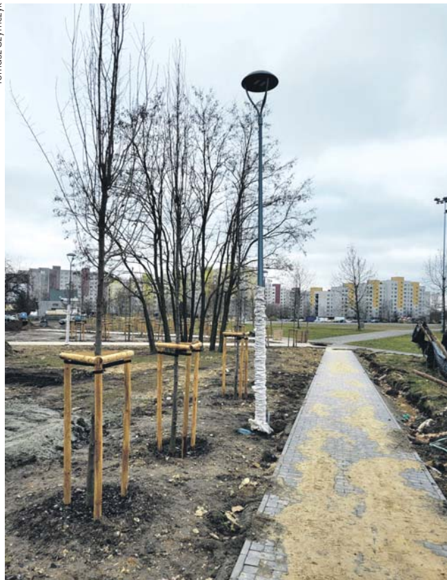
W parku posadzono m.in. graby pospolite i lipy drobnolistne.

Kończą się prace związane z budową nowego parku na Placu Papieskim w Klimontowie. Do wykonania pozostały już tylko nieliczne prace, których do-