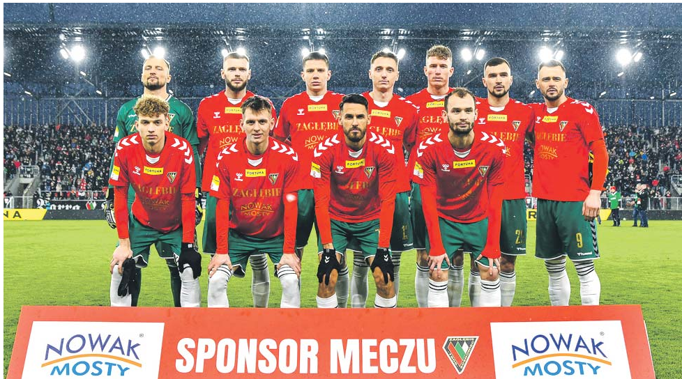
W takim składzie ekipa Zagłębia rozpoczęła pierwszy mecz na nowym stadionie.