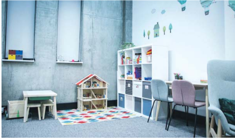
W centrum są cztery gabinety terapeutyczne.