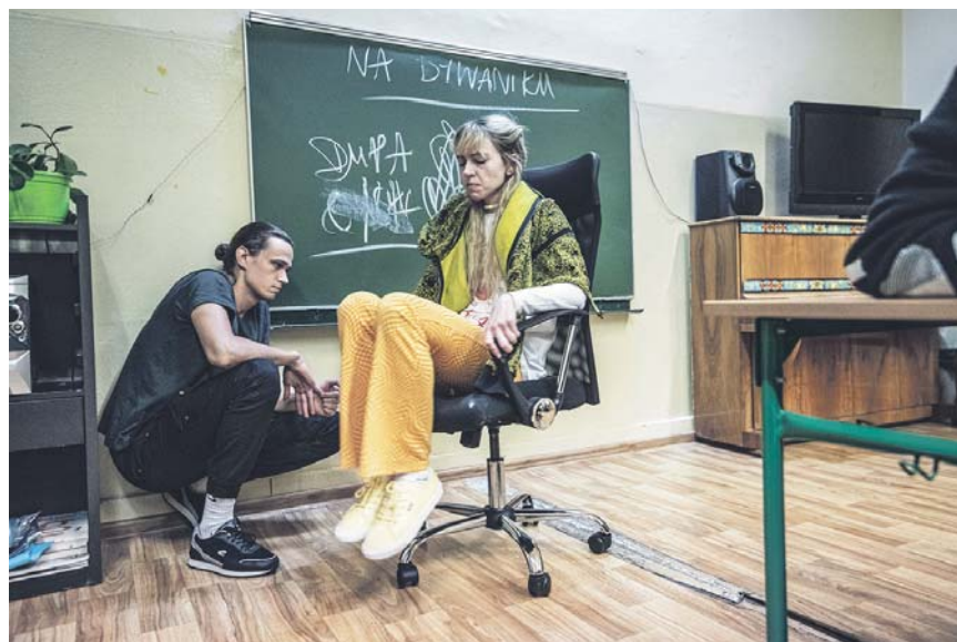
Integralną częścią spektaklu są warsztaty pedagogiczno-teatralne dla całej klasy.

„Niezgoda. jpg” należy do nurtu „teatru w klasie” i jest grana w salach lekcyjnych, po to, żeby twórcy teatru mogli spotykać się z uczniami i uczennicami w szkole, na znanym im terenie. Bohaterowie sztuki należą do tego samego pokolenia co widzowie, dlatego łatwiej im rozmawiać na trudne problemy, które ich spotykają, takie jak cyberprzemoc i przemoc rówie-