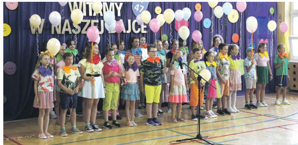
Ruszyła rekrutacja do sosnowieckich placówek. Należy pamiętać o terminach i składaniu wniosków.

Trwa również rekrutacja do klas pierwszych szkół podstawowych na rok szkolny 2023/24. Rodzice są zobowiązani do elektronicznego wypełnienia wniosku i złożenia wniosku o przyjęcie do szkoły pierwszego wyboru wraz z dokumentami potwierdzającymi spełnianie przez kandydata warunków lub kryteriów branych pod uwagę w postępowaniu rekrutacyjnym do piątku 17 marca, do godz. 15. Listy kandydatów zakwalifikowanych i niezakwalifikowanych zostaną opublikowane w piątek 24 marca do godz. 12. Potwierdzenie woli przyjęcia kandydata w postaci pisemnego oświadczenia rodziców będzie musiało nastąpić do czwartku 30 marca do godz. 15. Lista kandydatów przyjętych i nieprzyjętych będzie opubliko-