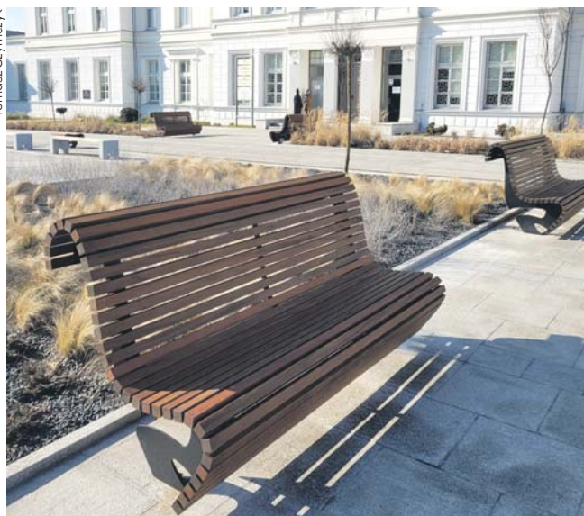
Na placu partiami montowane są już ławki, a oświetlenie ma być gotowe jeszcze w tym miesiącu.