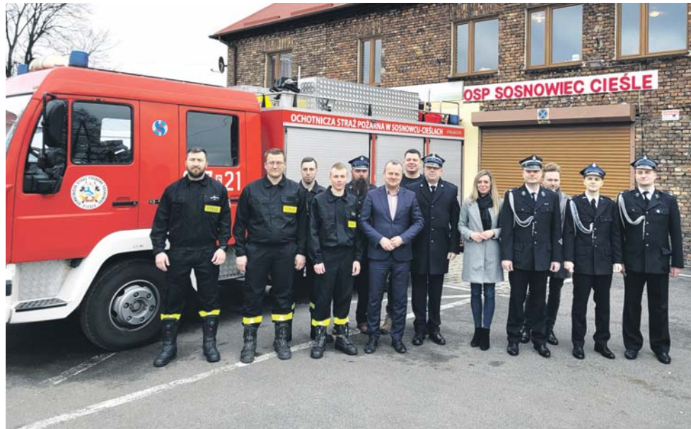
Strażacy z Cieśli zyskają m.in. nowy garaż dla samochodów bojowych.

– Ochotnicze straże pożarne są bardzo ważnym i istotnym elementem ochrony przeciwpo-