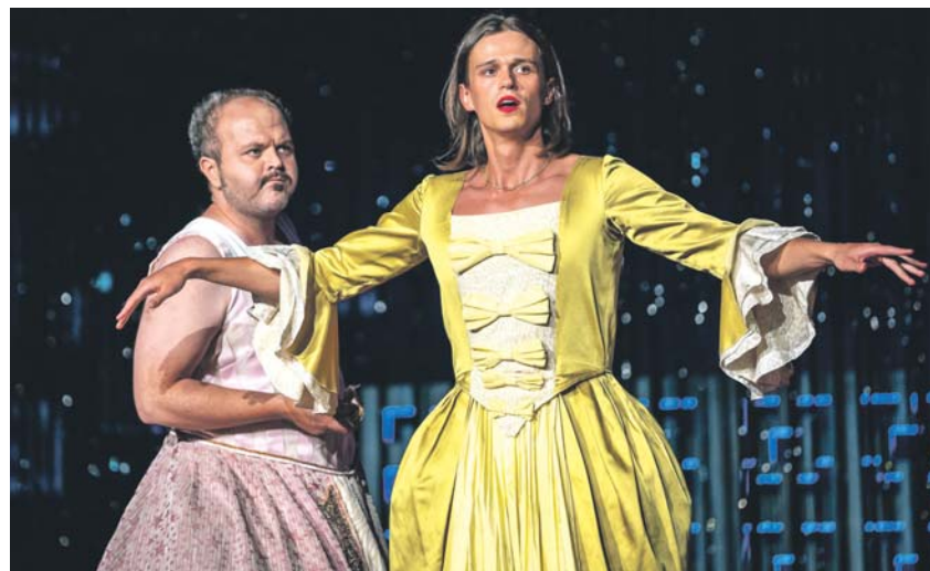
Spektakl „Poskromienie złoŹnicy” zyskał uznanie dziennikarzy podczas 26. Festiwalu Szekspirowskiego w GdaŹsku.

„Poskromienie złoŹnicy” w reŹyserii Jacka Jabrzyka to jedna z noworocznych propozycji Teatru Zagłabia. Spektakl, który został m.in. laureatem nagrody dziennikarzy podczas 26. Festiwalu Szekspirowskiego w GdaŹsku, uwodzi widzów ponadczasowym tekstem Szekspira i nowoczesnymi kontekstami współczesnych problemów.