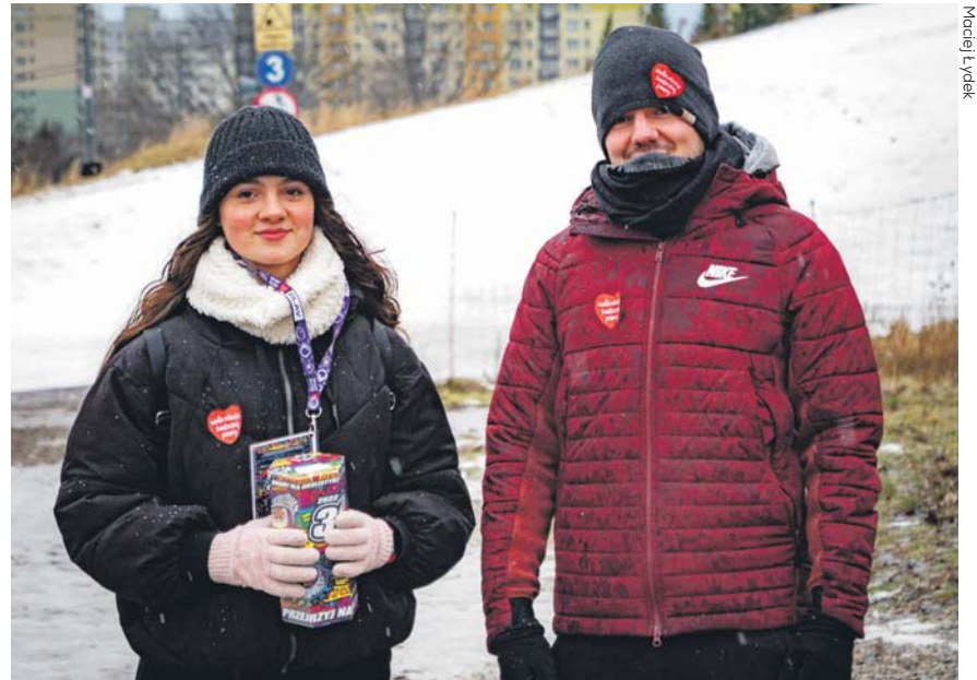
Wolontariusze Orkiestry są już gotowi do pracy i odliczają dni do wielkiego finału.

W Orkiestrową niedzielę warto będzie zajrzeć również do hali sportowej przy ul. Braci Mieroszewskich w Zagórz. Nie zabraknie tam kiermaszów, warsztatów i występów artystycznych.