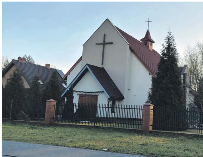
Kościół pw. św. Szymona i Judy Tadeusza na Borze.