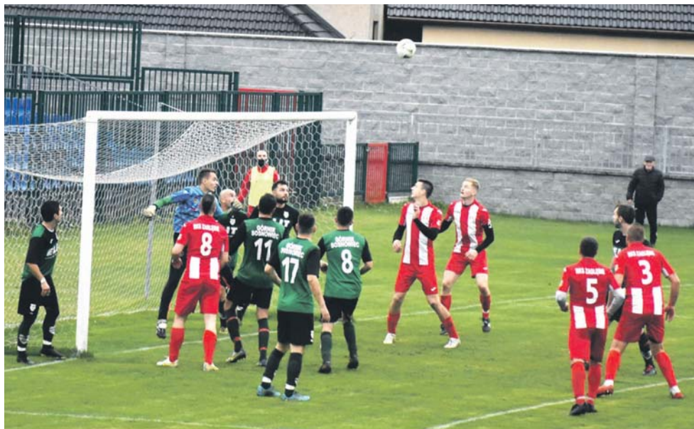
W klasie A rywalizują zawodnicy Górnika Sosnowiec, AKS-u Niwka i Zewu Kazimierz.