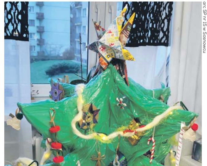
orc SP nr 15 w Sosnowcu

Dziękujemy wszystkim, którzy przesłali nam zdjęcia swoich choiniek! Na fotografii czekaliśmy do 31 grudnia. Na choinki można było głosować poprzez polubienia na Facebooku. Najwięcej „lajków” otrzymała choinka przygotowana przez uczniów klasy 6a Szkoły Podstawowej nr 15 im. Stefana Żeromskiego w sosnowieckiej dzielnicy Niwka. Gratulujemy i już teraz zapraszamy wszystkich sosnowiczankę za rok do udziału w drugiej edycji konkursu.