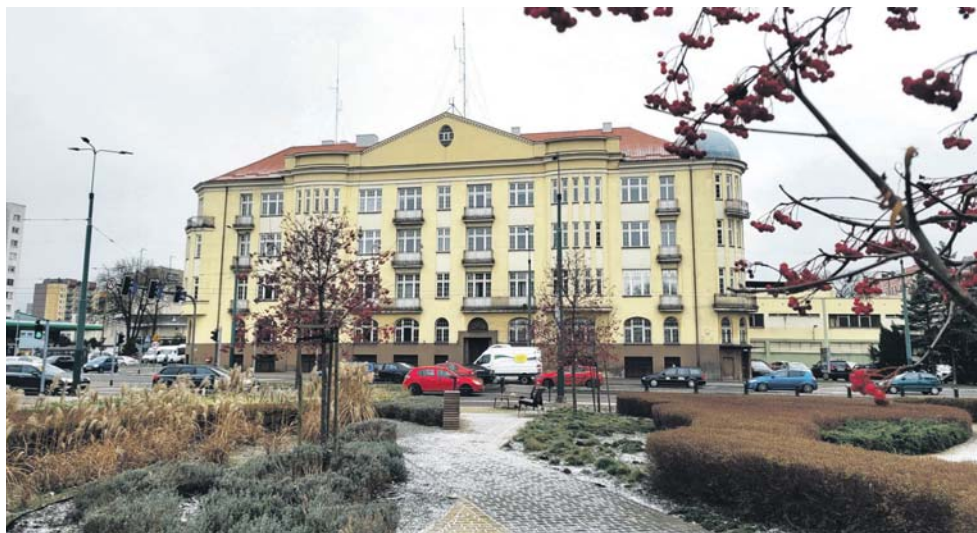
Do służby w CBZC przyjmowane są głównie osoby z wiedzą i umiejętnościami z zakresu informatyki i nowoczesnych technologii teleinformatycznych.

– Stan etatowy Zarządu w Katowicach CBZC cały czas się powiększa. Planowane jest zwiększenie struktury tej komórki do 60 etatów w 2023 roku, a docelowo nawet do 140 w 2025 roku. Dlatego też, konieczne będzie zapewnienie odpowiednich warunków lokalowo-technicznych, ponieważ w budynku KWP Katowice się nie zmieścimy – wyjaśnia podkomisarz Mar-