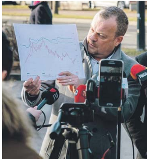
Samorządowcy zamierzają skierować wniosek w sprawie weryfikacji cen paliw do UOKiK.

– Mija kolejny rok zamachom na samorządność, a kultura to następny obszar, który władza centralna chce po prostu zawłaszczyć. Mówiono o kadencji, na które wybierane są władze samorządowe, a tymczasem nawet w tym obszarze dokonano zamachu na transparentność i wiarygodność wyborów, które zostały przesunięte w czasie. Dlatego liczymy, że nadchodzące wybory parlamen-