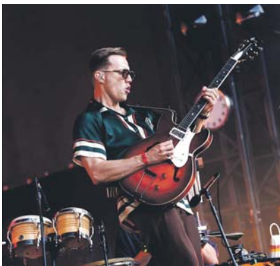
Mrozu tym razem wystąpi na scenie sosnowieckiej „Muzy”.

Twórca hitów z pierwszych miejsc list przebojów takich jak: „Aura”, „Złoto”, „Jak nie my to kto”, „Szerokie wody”, czyli Mrozu, juŹ 3 lutego wystąpi w Sali Widowiskowo-Koncertowej „Muza”. Mrozu, czyli Łukasz Mróz, jest autorem tekstów, kompozytorem i producentem swoich płyt. Jego ostatni, szósty juŹ album „Złote bloki” pokrył się złotem w trzy miesiące po swojej premierze, a po kolejnych czterech zdobył status platyny. Koncert rozpocznie się o godz. 19.00. Bilety w cenie 89 zł są do nabycia online na stronie: www.kiepora.pl , w kasie biletowej ECK przy ul. BędziŹskiej 65 i kasie biletowej Muza przy ul. Warszawskiej 2. st