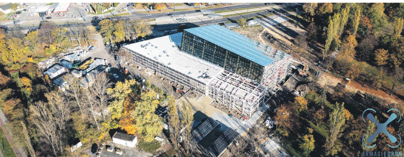
Na 2023 rok zaplanowano zakończenie rozbudowy i wyposażenie Egzotarium.

Kontynuowane będą przygotowania do budowy nowej sceny dla Teatru Zagłębia. W parku przy Pałacu Schoena modernizowane będą alejki. Samo muzeum zyska nowe oświetlenie w salach ekspozycyjnych. Podejmowane będą działania zmierzające do uzyskania przez GZM miana Europejskiej Stolicy Kultury. Powstawać będą nowe miejsca pamięci: poświęcone rewolucji 1905 roku przy wieży żużlowej przy ul. Staszica, koto górnicze w Miłowicach czy sala pamięci Władysława Szpilmana.