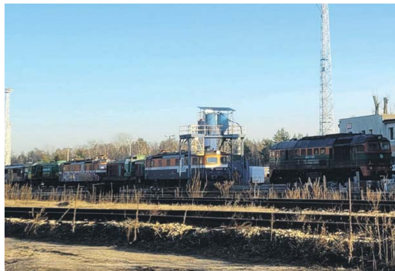
Dzielnica z wielu stron jest opleciona siecią torów kolei piaskowej.

browskiego. Jedną z nich została mała piaskownia Bór-Juliusz, która w 1952 roku zaczęła formalnie funkcjonować pod nazwą Maczki-Bór. To pod odkrywkowe wydobywanie piasku zaczęto wyrąbywać bory, które dały nazwę tej części miasta. Co ciekawe, nie tylko jej, bo przez wiele lat w rejonie ul. Grenadierów funkcjonował przecież szyb Bory należący do kopalni Kazimierz-Juliusz. Dzięki rozbudowanej sieci kolejowej piasek z tego rejonu zaczął docierać do wielu okolicznych kopalni. Ponieważ górnictwo w okresie PRL-u znajdowało się w rozkwicie, to i materiału podszkawkowego potrzeba było coraz więcej. Piaskownia szybko rozrosła się więc w kierunku Maczek przecinając tradycyjny szlak między Porąbką a Borem. Od tego momentu związki obu tych osad miały i mają już tylko charakter historyczny, bo funkcjonalnie i codziennie Bór zaczął ciężać w kierunku Niwki, za której część jest uważany dzisiaj.