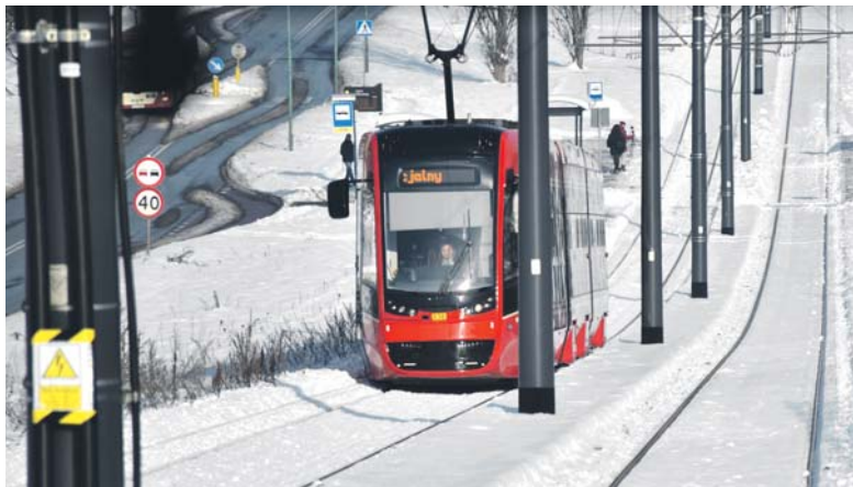
Nowa linia tramwajowa została otwarta po 40 latach. To historyczne wydarzenie dla mieszkańców, jak i Tramwajów Śląskich.

– Pierwsza jaskółka wiosny nie czyni, ale kierunek jest dobry. Realizuje-