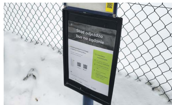
Na przystankach, które obsługuje bus, umieszczone zostały informacje, jak zamówić przejazd.

Linia obsługiwana jest 9-osobowym busem. Usługa jest odpłatna. Koszt to 3 zł za kurs. Taka forma komunikacji nocnej funkcjonuje w godzinach od 23.00 do 5.00. Już od kilkunastu miesięcy podobnie obsługiwana jest linia nocna kursująca po trasie linii tramwajowej nr 27 do Kazimierza Górniczego. W tradycyjny sposób – poprzez nocne kursy tramwajów – obsługiwane są linie nr 15 z Katowic przez centrum Sosnowca do Zagórze oraz nr 21 z Miłowic przez centrum miasta, Pogoń i Będzin do Dąbrowy Górniczej. tos