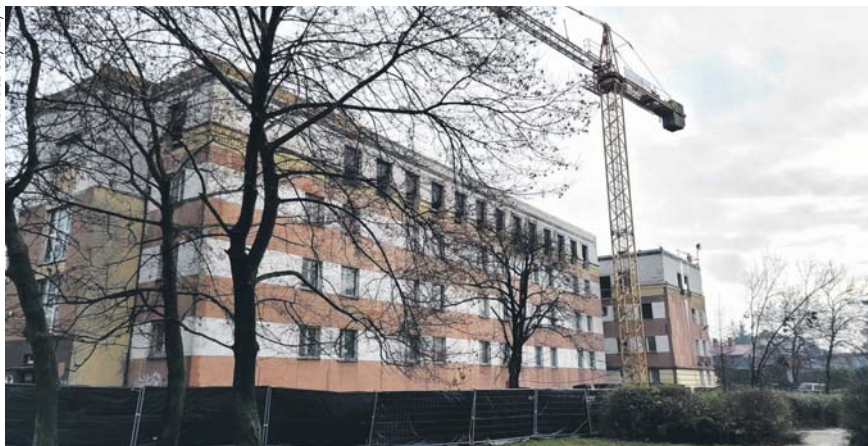
Trzypiętrowy budynek dawnego pogotowia, a wcześniej hotelu robotniczego, zostanie nadbudowany o jedną kondygnację.

Nowa siedziba Prokuratury Okręgowej w Sosnowcu powstaje w miejscu dawnej siedziby Pogotowia Ratunkowego przy ul. Czarnej w Sosnowcu. Jeszcze wcześniej był tutaj hotel robotniczy nieistniejącej już KWK Sosnowiec. Plac budowy przekazano już we wrześniu ubiegłego roku, a wykonawcą inwestycji jest Konsorcjum Budowlane PEPEBE Włocławek Przedsiębiorstwo Państwowe – Mazowiecka Instytucja Gospodarki Budżetowej Mazovia.