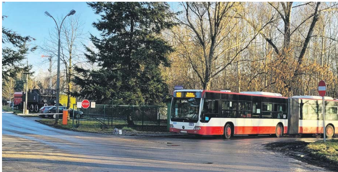
Do pętli na Borze dojeżdża dziś linia nr 150, kiedyś była to linia nr 26. Za bramą można zobaczyć zabytkową lokomotywę.

Na zakupy czy do lekarza mieszkańcy sosnowieckiej dzielnicy Bór udają się zwykle na Niwkę. To z tą dzielnicą Bór się zrósł i jest uważany za jej część. Niewielu wie jednak, że z historycznego punktu widzenia to część zupełnie innej starej sosnowieckiej dzielnicy, która do Sosnowca włączona została dużo wcześniej niż ona sama.