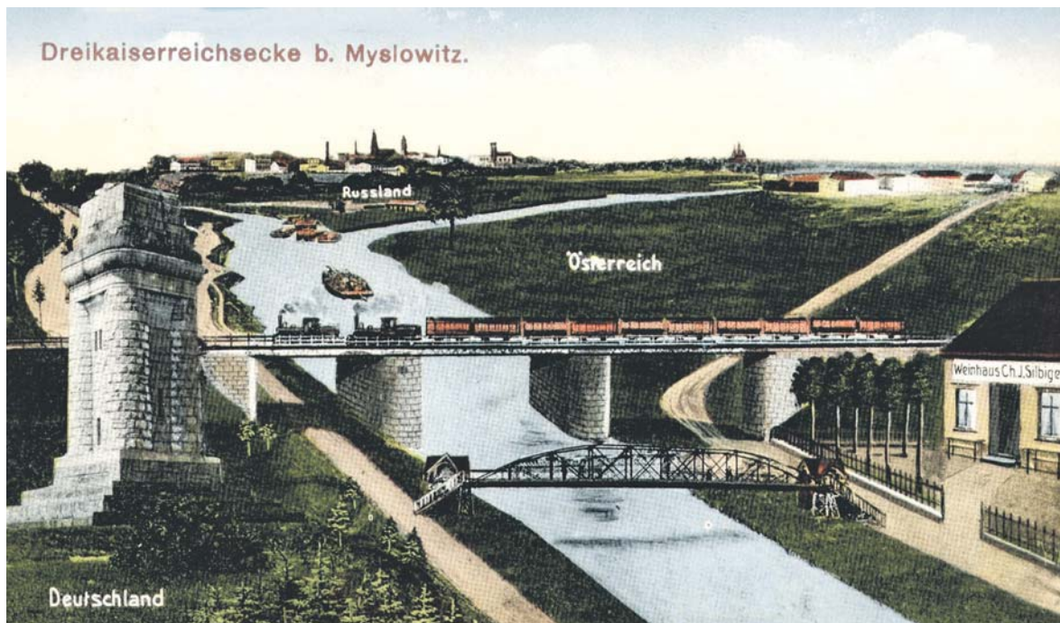
Trójkąt doczekał się niezliczonej ilości zdjęć i widokówek. Na większości z nich miejsce to jest opisane jako Drei Kaiserreich Ecke, czyli Kąt Trzech Cesarstw. Czyżby zatem tak właśnie należało je nazywać?

Po zwiedzeniu wystawy ponownie przekraczamy mostek i wracamy do ulicy Orłąt Lwowskich. Skręcamy w prawo, by dojść do przejścia dla pieszych, którym przedostajemy się na drugą stronę ulicy. Następnie wchodzimy w ulicę Żeglarską. Po przejściu niespełna 100 metrów na rozwidleniu odbijamy w lewo w ulicę Słodową. Idziemy prosto. Zwracamy uwagę na zabudowania ciągnące się po lewej stronie drogi. Tuż za ostatnim z nich skręcamy w lewo i korzystając z wąskiej ścieżki, wchodzimy na koronę wału przeciwpowodziowego. Przed nami rozpościera się widok na Białą Przemską oraz leżącą na jej drugim brzegu dzielnicę Jęzor. W czasach rozbiorowych Jęzor znajdował się na terenie Cesarstwa Austrii (później Austro-Węgier). Pewną ciekawostką stanowi fakt, że również wieś Niwka pierwotnie była zlokalizowana na lewym brzegu Białej Przemskiej. W miejscu, gdzie obecnie się znajduje (prawo brzeg), została przeniesiona w XVI w. Kontynuujemy naszą wędrówkę wraz z biegiem rzeki. Korona wału zapewnia doskonały widok na okolicę. Jeszcze niedawno można było obserwować na brzegach rzeki liczne ślady działalności bobrów. Niekiedy nawet udawało się zobaczyć te tajemnicze zwierzęta. Szczególnie młode osobniki nie stosu-