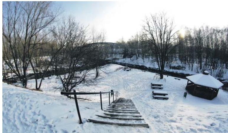
Teraz miejsce to jest wyjątkowo spokojne, ale niegdyś potrójna koncentracja granic państwowych powodowała nasilenie przemytu, który generował zarówno problemy, jak i przynosił spore profity – także przekupnym strażnikom granicznym. W 1906 r. na granicach zatrzymano ok. 11 000 „szwarcowników” – blisko połowa z nich zawodowo trudniła się przemtem.

Z biegiem lat niepozorne połączenie dwóch zagłębiowskich rzek stało się osobliwością na skalę europejską. Rzesze turystów (głównie z Niemiec) gromadnie przybywały w to miejsce. Powstała infrastruktura towarzysząca w postaci bazy noclegowej, gastronomicznej i handlowej. Ponad Przemską zbudowano specjalny mostek, wytyczono drogi dla dorożek i omnibusów. W Mysłowicach powstała przystań dla statków spa-