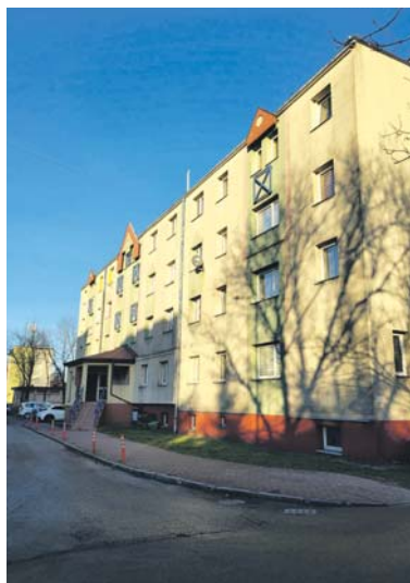
W dzielnicy istniało kiedyś kino Oaza.

We wrześniu 1950 roku ówczesny minister górnictwa Ryszard Nieszporek podpisał rozporządzenie tworzące Przedsiębiorstwo Materiałów Podszkawkowych Przemysłu Węglowego zarządzające kilkunastoma piaskowniami w rejonie Śląska i Zagłębia Dą-