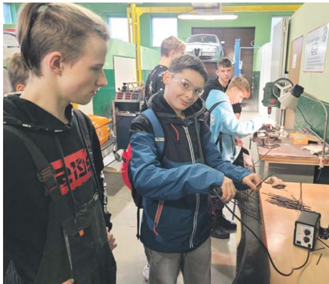
W kolejnym roku szkolnym przygotowano dla uczniów nowe kierunki z branży kolejowej i energetycznej.

I to się udało, bo w pracowni kolejowej można było przestawić dźwignię nastawni mechanicznej, w warsztatach szkolnych poczuć zapach smarów i olejów, a na salę gimnastyczną spojrzeć poprzez niwelator geodezyjny. W każdym z miejsc, które odwiedzali ósmoklasiści, czekały też na nich specjalne zadania. Ci, którzy je wykonywali, brali udział w loterii. Swoistą re-