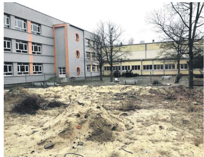
Nowy oddział żłobka powstanie w części budynku ZSO nr 3 w Sosnowcu.

– Żeby to dobrze zobrazować: to tak duża przestrzeń, że można by wybudować na niej dom i mieć jeszcze spory ogródek. Pierwotnie remontem miała być objęta tylko część patio. Ostatecznie zdecydowaliśmy się na całość, która będzie podzielona na przestrzeń dla