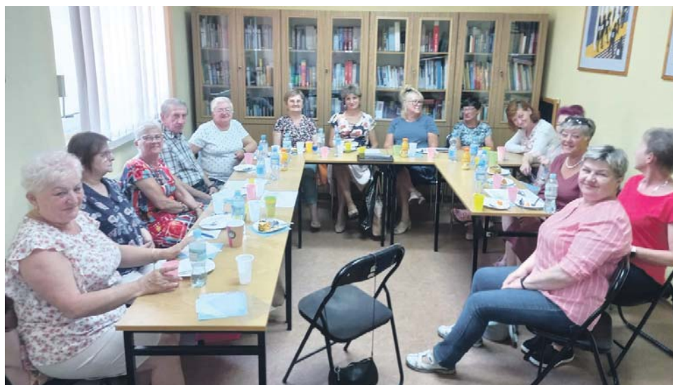
Spotkania seniorów odbywają się m.in. w siedzibie biblioteki przy ul. Spadochroniarzy w Sosnowcu.