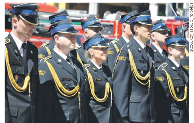
Strażackie święto było okazją do wręczenia awansów, nagród i odznaczeń. W tym roku mija 30 lat od powołania Państwowej Straży Pożarnej.

Dzień Strażaka przypada w kalendarzu 4 maja, ale sosnowieckie obchody tego święta odbyły się prawie niemal miesiąc później. W tym roku strażacy mają dodatkowy powód do świętowania, bo mija trzydzieści lat od powołania Państwowej Straży Pożarnej.