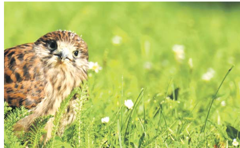
Zabawa w chowanego.