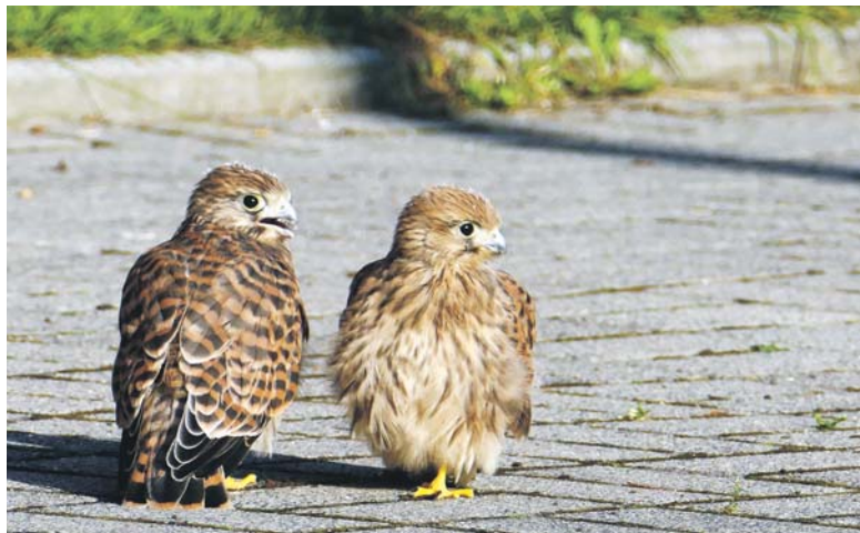
Maluchy na przykościelnym chodniku.

Byłem kiedyś świadkiem dość interesującego zachowania dorosłych pustułek względem własnego (jak się później okazało) potomstwa. Otóż obserwowałem z dość znacznej odległości baraszkowanie w trawie trzech młodych osobników. Nagle, niczym grom, spadły na nie dwie dorosłe pustułki. Dosłownie z całym impetem rzuciły się na młodziaków. Zaczęły przy tym rozpościerać skrzydła, przgniatać młodych do ziemi i o zgrozo dziobać. Choć żal mi się zrobiło pełnych życia, rozbrykanych piskląt, to postanowiłem nie interweniować. Trzymałem odpowiedni dystans i czekałem, aż prawa natury zdecydują o życiu i śmierci. Po chwili, gdy młode były już niemal przyklejone do ziemi i przykryte skrzydłami dorosłych pustułek, zrozumiałem, co się stało. Kiedy ja z zapałem oddawałem się fotografowaniu młodych, byłem bacznie obserwowany przez rodziców. Pomimo tego, że starałem się nie podchodzić zbyt blisko, to zostałem zaklasyfikowany jako zagrożenie dla pustułkowego potomstwa. Inten-