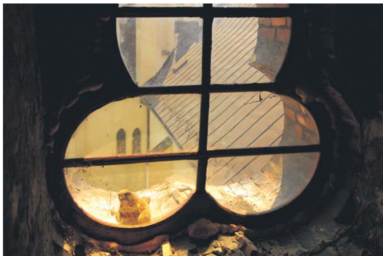
Zdjęcie pustułki wysiadującej jaja na parapecie okna kościelnej wieży stało się jednym z moich ulubionych. Chętnie je udostępniam. Przyznam, że niemałą satysfakcję sprawiło mi zamieszczenie go w artykule naukowym Włodzimierza Cichockiego o pustułkach. Tekst został opublikowany w czasopiśmie „Tatry”, wydawanym przez Tatrzański Park Narodowy (nr 72, wiosna 2020).