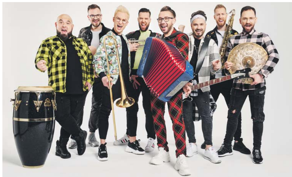
Impreza w parku rozpocznie się z rockowym przytupem i folkowym brzmieniem grupy Enej.