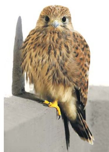
Młoda pustułka odważnie spogląda w oko teleobiektywu.

Pozwolę sobie jeszcze wspomnieć moje pierwsze bardzo bliskie spotkanie z pustułką. Było to pod koniec kwietnia 2008 roku. Dzięki uprzejmości gospodarzy parafii świętego Joachima wybrałem się na północną wieżę kościoła w celu wykonania zdjęć. Interesowały mnie zarówno tajemnicze wnętrza, jak i piękne widoki na całą okolicę. Wyprawę tę ze względu na dużą ilość rozmaitych emocji jakie jej towarzyszyły, pamiętam doskonale i bardzo miło wspominać. Dzięki niej mogłem zobaczyć