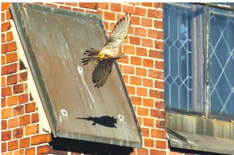
Dorosłe pustułki nie imponują wielkością, ale są doskonałymi łowcami. Swych zdobyczy wypatrują zarówno w spoczynku, jak i w locie – potrafią dostownie zawisnąć w powietrzu. Ofiarę mogą dostrzec z odległości 1,6 km, posiadają zdolność widzenia w nadfiolecie.

Artur Ptasieński, Centrum Informacji Miejskiej