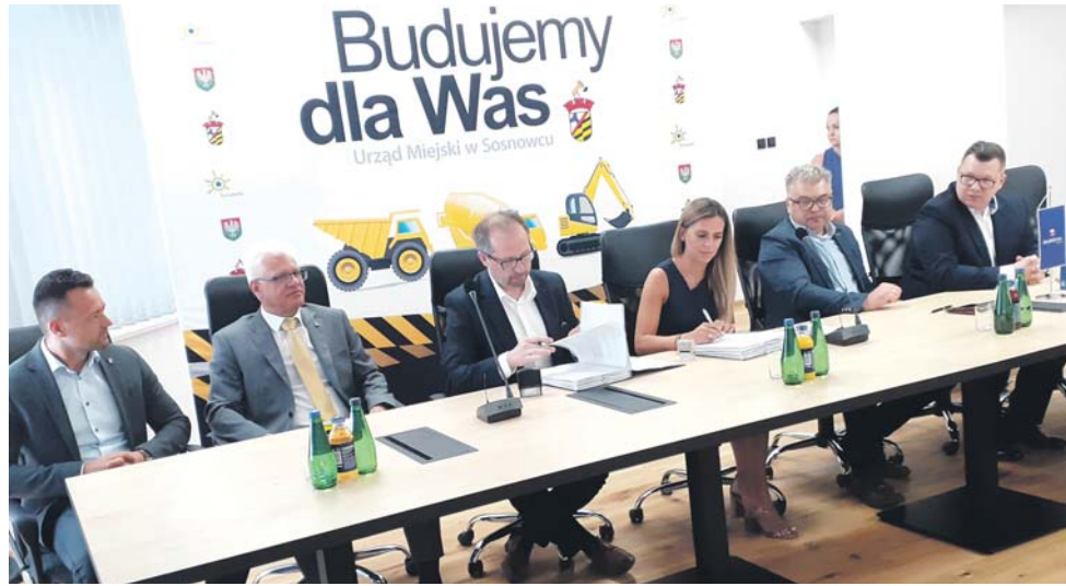
Wśród planowych inwestycji są prace m.in. na ul. 1 Maja, Sienkiewicza, Zaruskiego czy Wojska Polskiego

Kompleksowa przebudowa dróg na terenie gminy Sosnowiec, bo pod taką właśnie nazwą realizowane będzie to zadanie, została podzielona na siedem części i obejmuje następujące inwestycje: przebudowę ul. 1 Maja, ul. H. Sienkiewicza, ul. J. Piłsudskiego, przebudowę ul. Orlej, ul. Parkowej, ul. Wawel, rozbudowę skrzyżowania ul. Lenartowicza z al. Paderewskiego, przebudowę wiaduktu drogowego nad torami PKP w ciągu ulicy Wojska Polskiego w Sosnowcu, przebudowę ul. Małachowskiego, rozbudowę ul. Gen. Mariusza Zaruskiego, budowę drogi łączącej ul. Sedlaka i ul. Niepodległości.