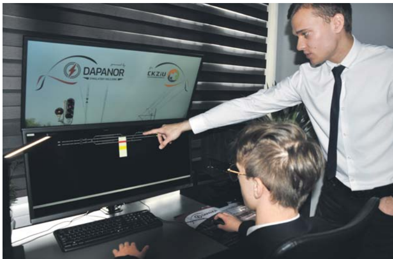
To jedna z najnowocześniejszych pracowni sosnowieckiego CKZiU.

– Pracownia pozwoli naszym uczniom pozyskać umiejętności prawidłowego prowadzenia ruchu kolejowego również w sytuacjach kryzysowych.