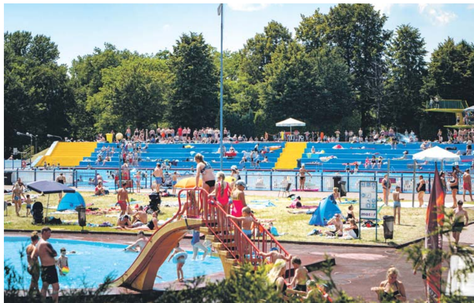
W czasie upałów najprzyjemniej można spędzać czas na miejskich basenach.

Warto także zajrzeć do Sosnowieckiego Centrum Sztuki – Zamku Sieleckiego. W każdy wtorek przez