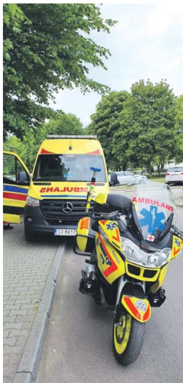
Od maja motoambulans wyjeżdżał do zdarzeń stanu zagrożenia życia i zdrowia już kilkadziesiąt razy.

Od początku maja motoambulans wyjeżdżał do zdarzeń stanu zagrożenia życia i zdrowia już kilkadziesiąt razy. – Ratownik na motocyklu jest w stanie dotrzeć do poszkodowanego dużo szybciej niż ambulans, rozpoznać sytuację i ocenić, jaki sprzęt będzie potrzebny oraz rozpocząć udzielanie pierwszej pomocy w jak najkrótszym czasie, co może wpły-