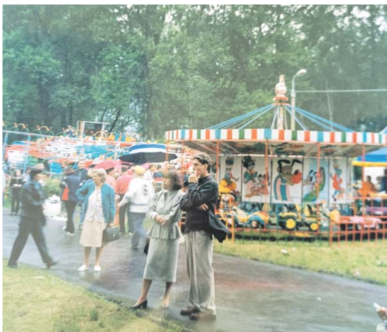
Karuzele i wesote miasteczko to od wielu lat nieodłączna część miejskiego święta.

łowicach, informowano, że będzie to impreza z „udziałem znanych artystów”. Uznano, że szczegóły nie są istotne. Niezwykle atrakcje czekały za to na sosnowiczanki w amfiteatrze w Parku Sieleckim, gdzie zaprezentowały się... zespoły estradowe Zjednoczenia Przemysłu Cementowego, Wapiennego i Gipsowego. Jeśli komuś było mało, mógł zajrzeć przed Urząd Miejski, gdzie na estradzie można było zobaczyć... zespoły estradowe Kombinat Cementowego Chełm i ZCW Góraźdze. Młodzież była jednak zadowolona, bo zaproszono też zespoły Krzak, Exodus i Kombi.