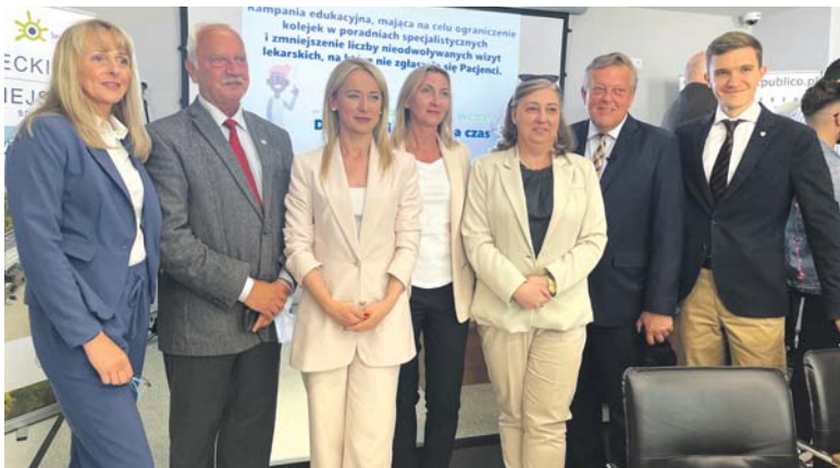
Ogłoszona kampania ma pomóc w ograniczeniu kolejek w poradniach specjalistycznych i wpłynąć na skrócenie czasu oczekiwania na wizytę.