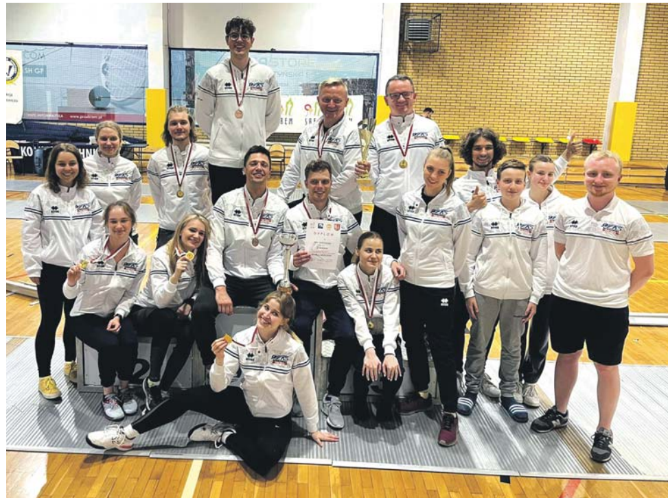
Reprezentanci Zagłębiowskiego Klubu Szermierczego zdobyli aż pięć medali seniorskich Mistrzostw Polski w szabli, które odbyły się w Śremie.

Do dwóch złotych medali sosnowieckie szabliski i szabliski dorzucili trzy medale w rywa-