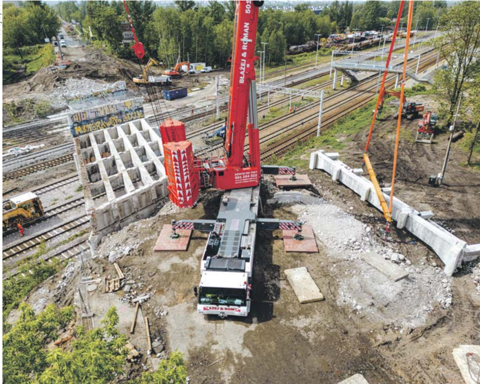
Kończą się prace przy rozbiórce starego wiaduktu.

Trwają prace związane z budową nowego wiaduktu nad torami kolejowymi w ciągu ulicy Wojska Polskiego. Wykonawca robót kończy wyburzanie podpór nowego wiaduktu. Co jeszcze dzieje się na placu budowy?