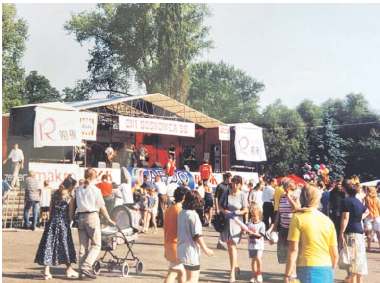
Tak wyglądała scena na Dniach Sosnowca w 1998 r.