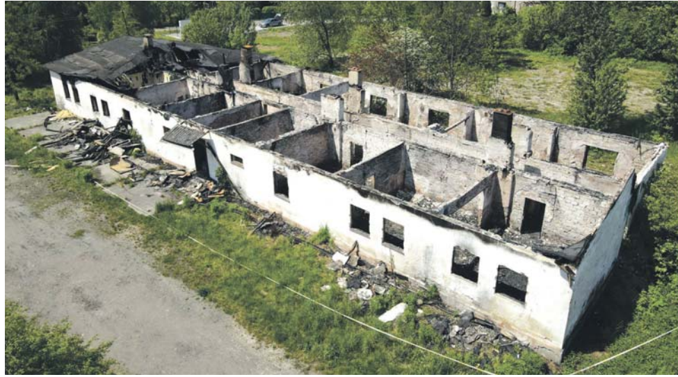
Barak spłonął 10 maja. Postępowanie w tej sprawie prowadzi policja.