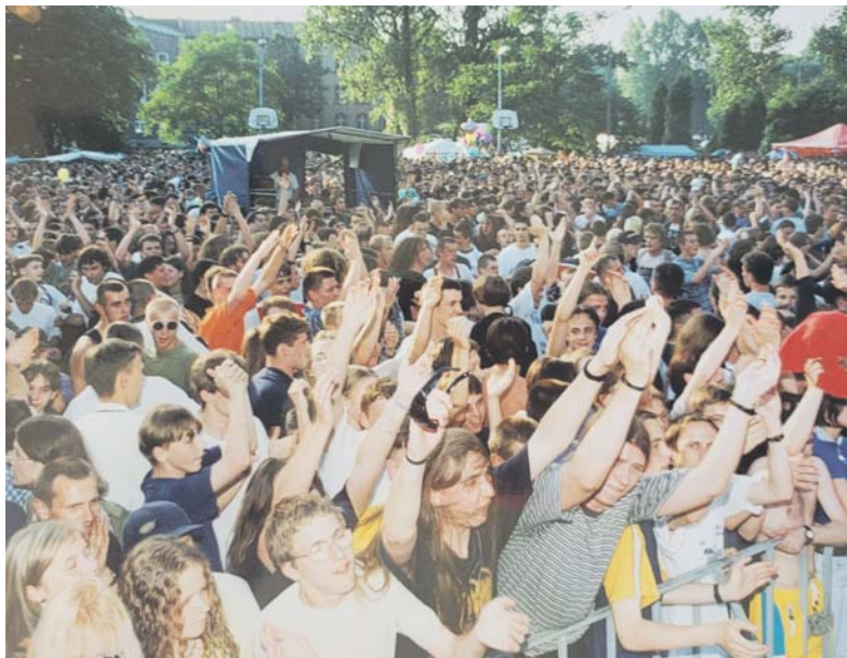
Dni Sosnowca zawsze cieszyły się popularnością wśród mieszkańców.

Dobrej reklamy nie miały Dni Sosnowca w 1980 roku. Żeby przypadkiem ktoś nie wybrał się na inauguracyjny koncert w hali sportowej w Mi-