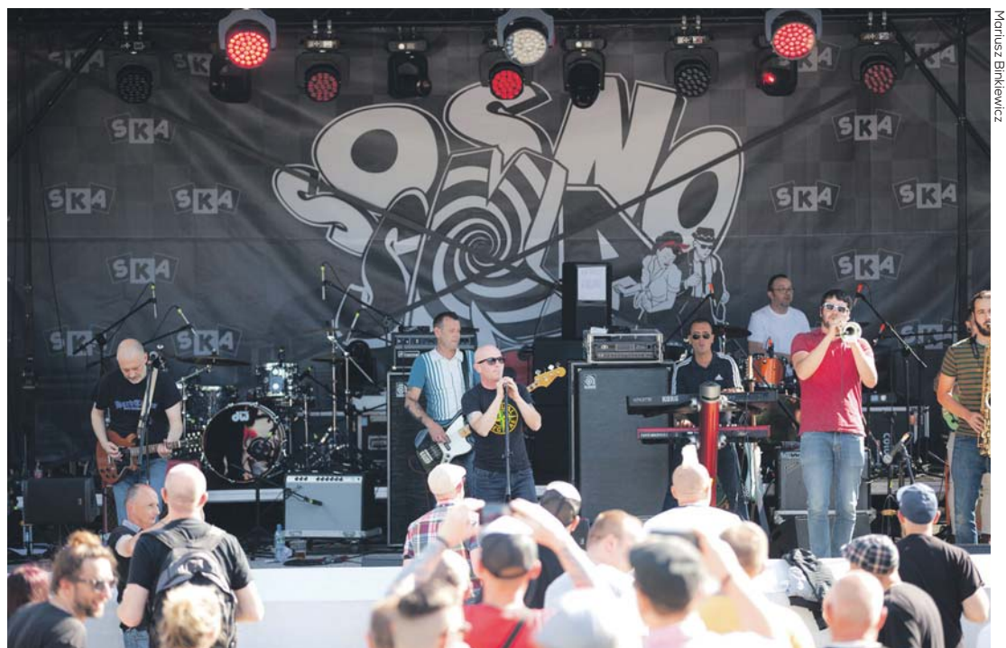
Pierwsza edycja festiwalu odbyła się w ubiegłym roku.

Świętująca w tym roku 30-lecie funkcjonowania grupa Skankan, której w Sosnowcu nie trzeba przedstawiać oraz zespół Konopians pojawią się na scenie podczas tegorocznej imprezy. Na liście artystów, któ-