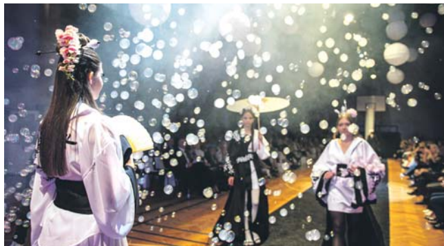
Podczas pokazu zaprezentowano prawie trzydzieści zjawiskowych kreacji, inspirowanych kulturą Japonii. Po pokazie gościom zaserwowano przysmaki, przygotowane przez uczniów i jubileuszowy tort.

– Nie ukrywam, że powstanie Centrum Kształcenia Zawodowego i Ustawicznego było trudnym i wymagającym procesem. Cieszę się, że taka decyzja została przed dziesięć laty podjęta. Dziś wszyscy świętujemy sukces, ponieważ osiągnięcia uczniów i związany z nimi ciągły rozwój