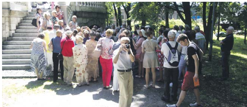
Zwiedzanie z przewodnikiem Pałacu Schoena zawsze cieszy się dużym zainteresowaniem gości.

Tegoroczną edycję Industriady, czyli największego festiwalu dziedzictwa przemysłowego w tej części Europy i prawdziwego święta Szlaku Zabytków Techniki celebrować będziemy w 46 obiektach, w tym w Pałacu Schoena Muzeum w Sosnowcu. Motywem przewodnim XIV edycji Industriady jest „Sztuka Przemysłu”. Już 17 czerwca goście wyruszą w podróż, w czasie której przekonają się, jak przemysł nierozdzielnie łączy się również ze sztuką i jak wpływał na rozwój naszego regionu, kulturę, modę, zwyczaje, a nawet upodobania kulinarne.